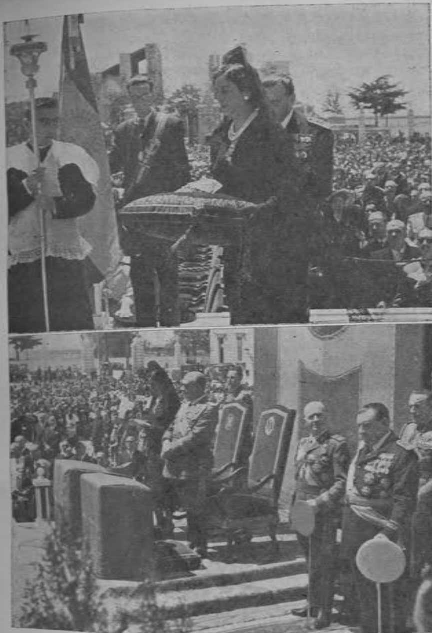
La respetable señora Doña Carmen Polo de Franco, esposa del Generalísimo, conduciendo la diadema con la cual se coronaría la imagen de Nuestra Señora de Guadalupe, llevada a España por el Excmo. señor Arzobispo de México. — El Generalísimo Don Francisco Franco y su señora esposa, oyendo devotamente la Misa celebrada en la plaza de la Armería, Madrid.