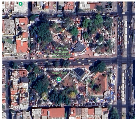
Figura 1. Vista del Parque Rojo con tianguis. Imagen del 1 de febrero de 2025.