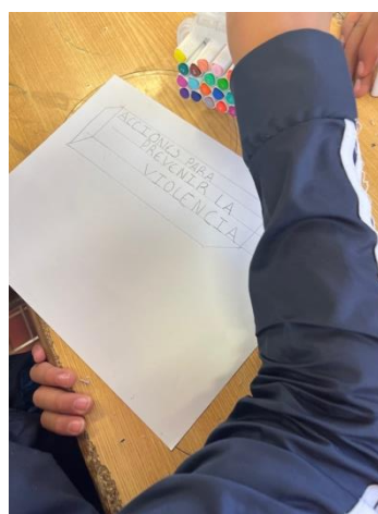
Anexo 6. Actividad sobre campañas preventivas a favor de la cultura de la paz.