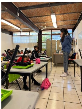
Anexo 1. Taller psicoeducativo para la resolución de conflictos no violenta en Primaria.