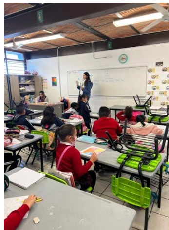
Anexo 4. Taller psicoeducativo para el desarrollo de habilidades socioafectivas en Primaria.