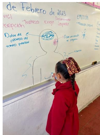
Anexo 2. Identificación de reacciones corporales para una mejor gestión emocional.