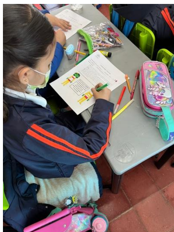
Anexo 5. Actividad sobre el semáforo corporal para la prevención al Abuso Sexual Infantil.