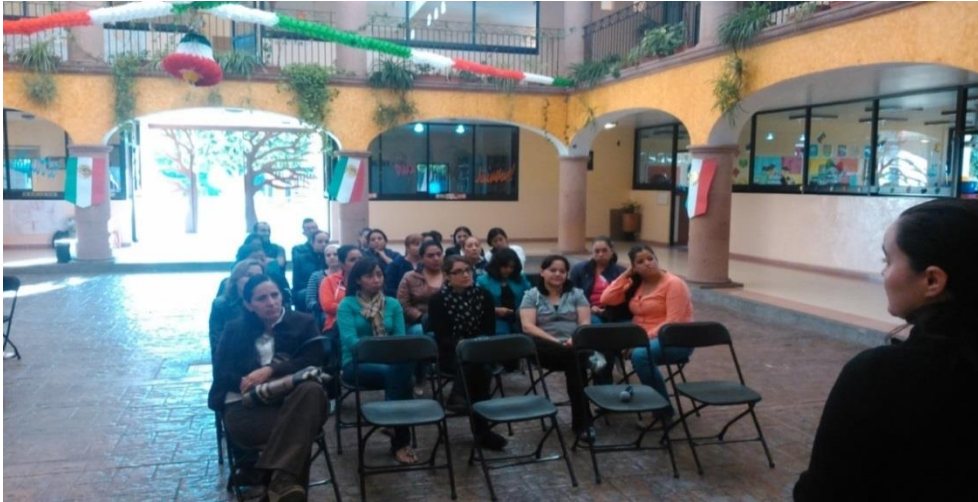
Fotografía de la primera reunión informativa.

La colaboración no sólo se de en estas reuniones, sino también fuera de ellas.