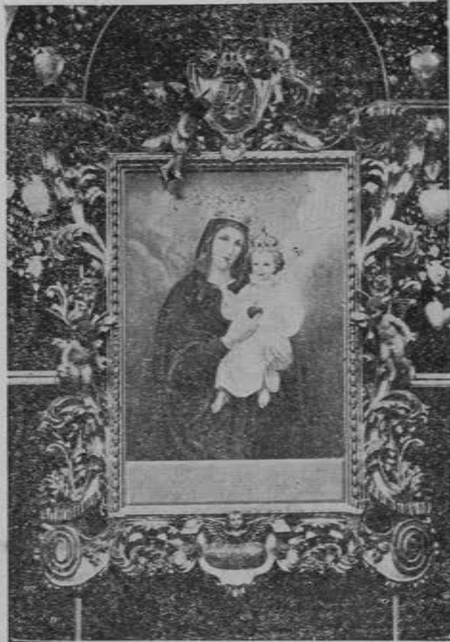
Marco para Nuestra Señora del Sagrado Corazón ejecutado por orden del Sr. Pbro. D. Ismael Villalba, capellán de la Iglesia del centro de San Pedro, ubicada en la calle de Francisco de Garay Núm. 6, de esta Capital. La imagen fué pintada por el artista Don Pablo Cruz, cuyo estudio está a sus órdenes en la calle de Tabasco Núm. 222.