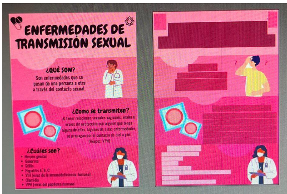
Imagen 1. Primeras correcciones

Empezamos con un borrador para darnos una idea del acomodo de la información y los gráficos. Se hicieron varios cambios que propusimos ambas como equipo y estuvimos de acuerdo con ellos. Como se mencionó anteriormente, queríamos que el manual fuera muy sencillo de leer, no poner demasiada información y que los colores fueran atractivos para nuestro usuario.