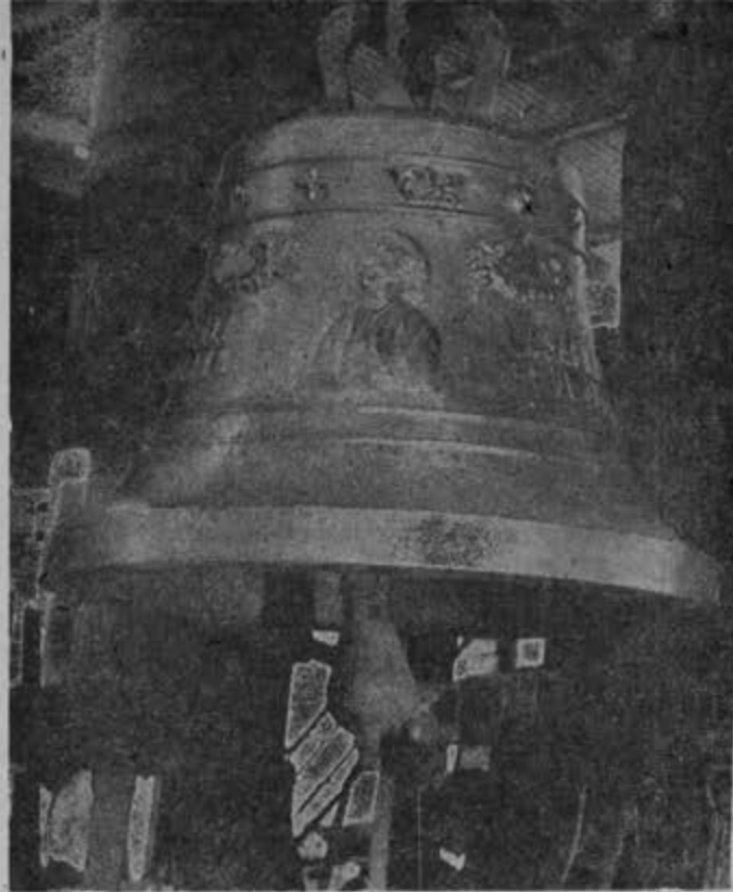
Esta campana fue fundida para la parroquia de la Sagrada Familia, Esq. de Puebla y Orizaba