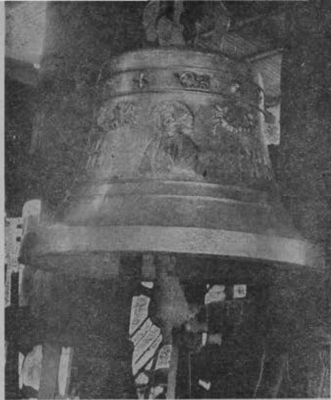
Esta campana fue fundida para la parroquia de la Sagrada Familia, Esq. de Puebla y Orizaba