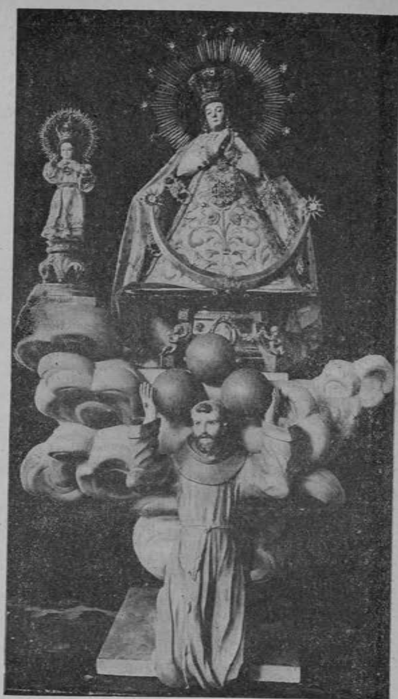
Nuestra Señora del Pueblito que fué solemnemente coronada el 17 de Octubre en Querétaro, Qro.

La cual fué colocada en el altar y comenzó la misa pontifical votiva solemne de Nuestra Señora del Pueblito, que cantó el Señor Obispo de Querétaro y en la que el Señor Arzobispo de Méjico predicó elocuentísimo sermón y terminada la misa fué leído el documento pontificio que autoriza la coronación y delega al Señor Obispo de Querétaro para hacerla; fueron bendecidas las coronas de la Virgen María y del Santo Niño que tiene a un lado y pusieron simultáneamente las dos coronas el Señor Arzobispo de Méjico y el