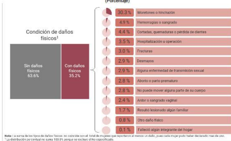
Gráfica 17 DISTRIBUCIÓN DE MUJERES DE 15 AÑOS Y MÁS QUE HAN EXPERIMENTADO ALGUNA SITUACIÓN DE VIOLENCIA FÍSICA Y/O SEXUAL POR PARTE DE SU PAREJA A LO LARGO DE LA RELACIÓN POR LOS DAÑOS FÍSICOS DERIVADOS DE LA VIOLENCIA EXPERIMENTADA (Porcentaje)

Respecto al periodo del mes de octubre de 2020 al mismo mes del próximo año (2021), el mayor grado de incidencia de violencia en la relación de pareja fueron en los siguientes estados: Guerrero con el 25.9%, Querétaro con el 25.1% y Aguascalientes con el 24.8%, mientras que los estados que tienen un grado menor de concurrencia de violencia son: Tamaulipas con el 16.7%, Baja California con el 13.3% y Chiapas con el 12.6.