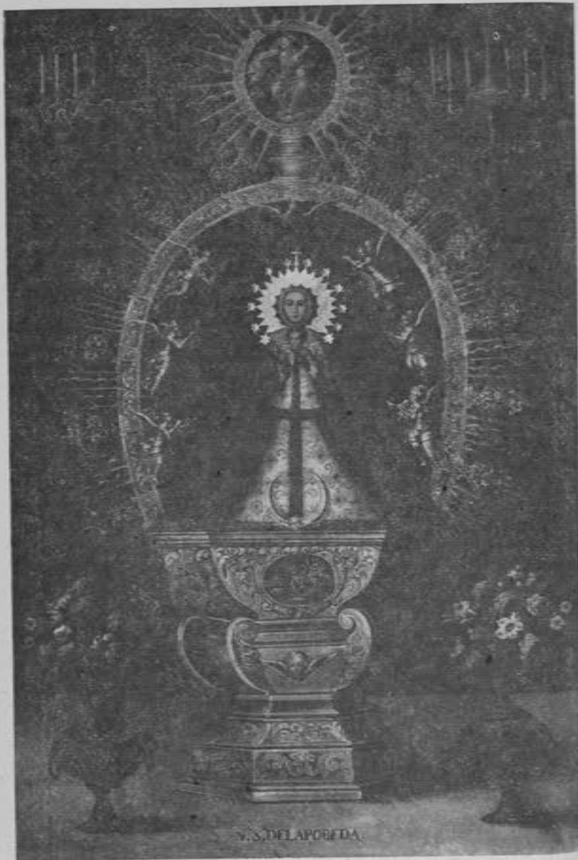
Nuestra Sra. de la Pobeda que se venera en la Parroquia de San Salvador Atoyatempam, Pue.

tidos ampones. La Virgen María tiene enmarcada la cara en un óvalo, como la de Guadalupe de Extremadura, la de Fuensanta, de Murcia y otras muchas en España y un resplandor con algunos remates de estrellas y descansa sobre una peana de tres cuerpos.