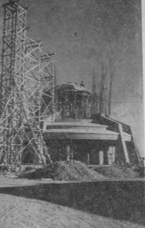
MONUMENTO A CRISTO REY EN LA CUMBRE DE LA MONTAÑA DE SU NOMBRE

Sobre la Cripta de diez metros de altura y que sólo se ve por la parte oriental remetida en el flanco de la montaña, se asienta la rotonda que se ve en esta foto, totalmente vaciada en grandes masas de concreto armado sobre la rotonda se está armando la cimbra de la cúpula sobre cuya línea curva se inclinará siguiendo la forma, todo el bosque de varillas que se advierte al rededor. De la torre del malacate a la izquierda vendrá el concreto para el vaciado de la cúpula, que soportará el peso de la Monumental Estatua de Cristo Rey.