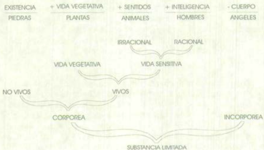
Arbol de Porfirio