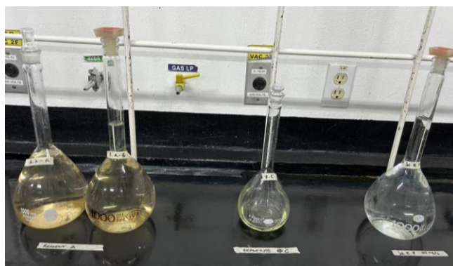
Ilustración 1. Soluciones.

Posteriormente se tomaron las mediciones de transmitancia para cada muestra y así obtener la absorbancia mediante la ecuación 1.