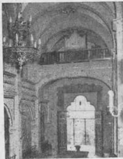
Organo WALCKER instalado en el Cerrito del TEPEYAC en 1953.