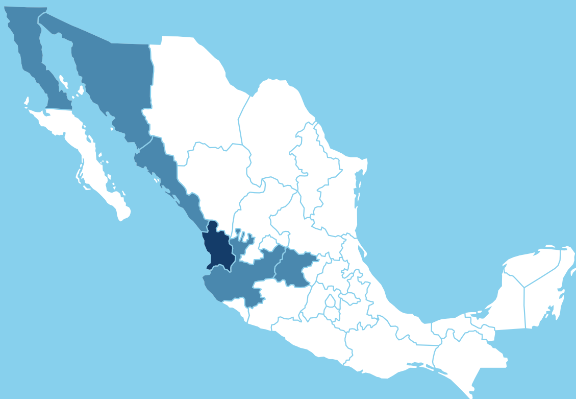
Figura 1. Mapa de localización geográfica en la región

Nayarit tiene una extensión territorial de 27,856.5 km 2 , lo que representa 1.4% del territorio nacional. Una parte considerable tiene salida al mar, en donde se ubican cuatro puertos importantes: San Blas, Chacala, Nuevo Vallarta y Cruz de Huanacastle. Cuenta, además, con un patrimonio cultural y natural importante (INEGI, 2020a; Secretaría de Marina, 2021).