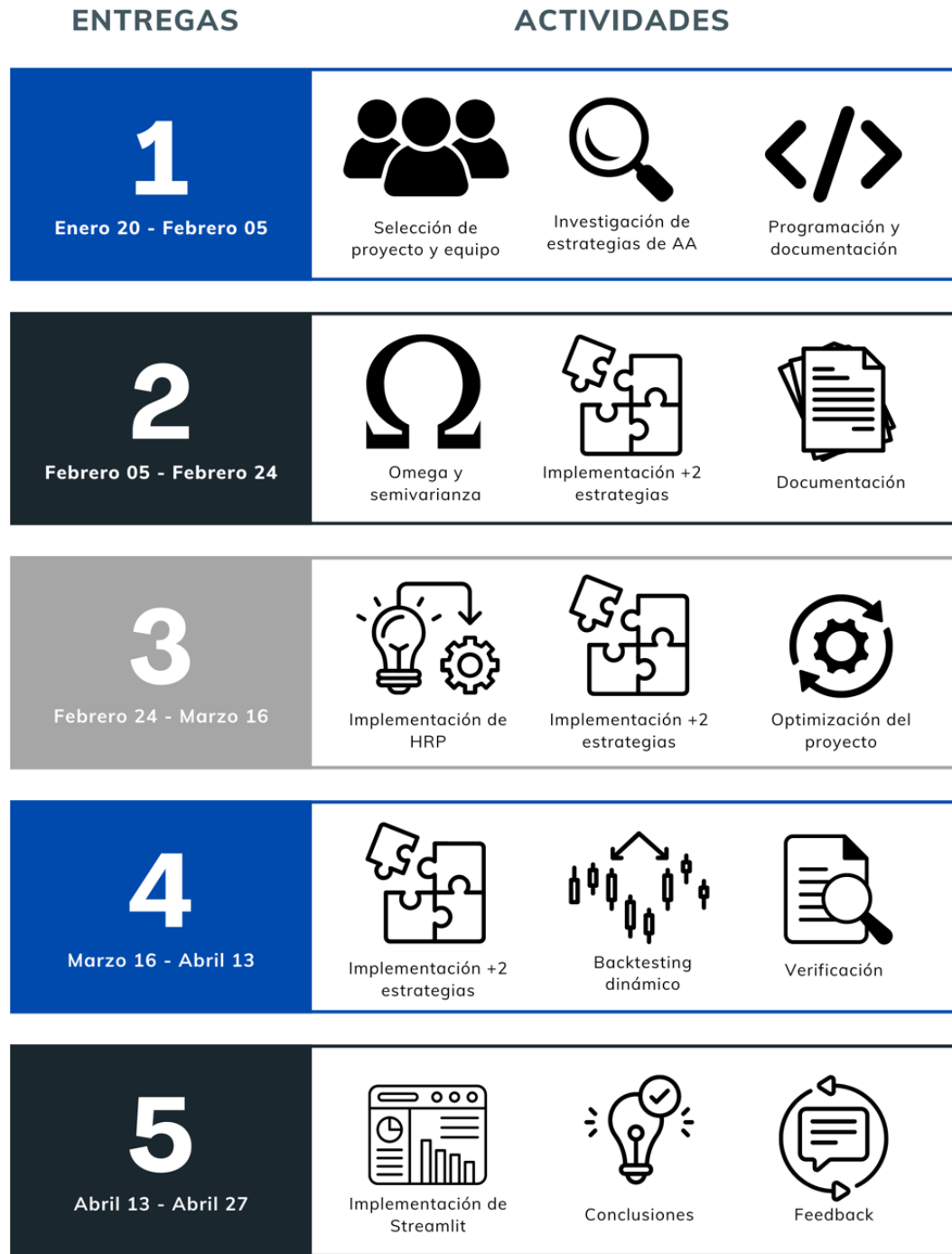
Ilustración 1. Cronograma PAP