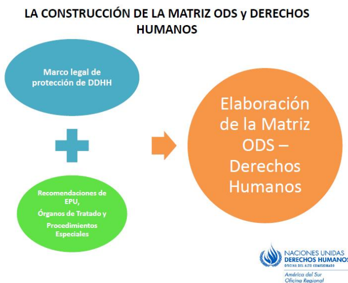
Gráfico 2. Interrelación entre los ODS y los derechos humanos.