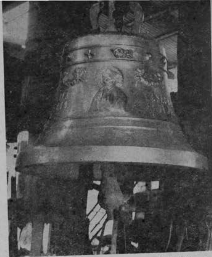
Esta campana fue fundida para la parroquia de la Sagrada Familia, Esq. de Puebla y Orizaba