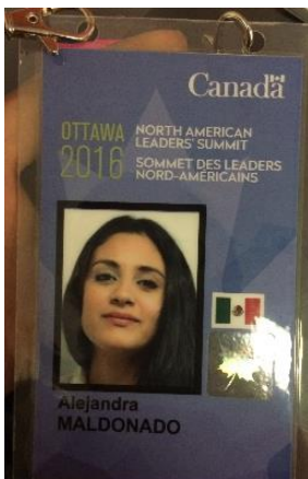
Figure 3 Gaffete oficial para la entrada a los eventos pertinentes al North American Leader's Summit.