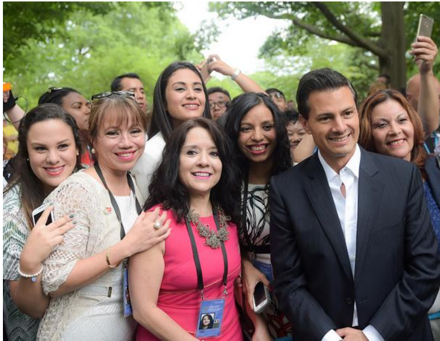
Figure 2 Visita del Presidente Enrique Peña Nieto para el North América Leader Summit en la ceremonia de plantación del árbol conmemorativo en la casa del Gobernador.