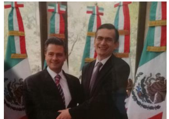
Figure 5 El presidente de los Estados Unidos Mexicanos Enrique Peña Nieto y el Embajador de México en Canadá Agustín Lopez-Laoeza