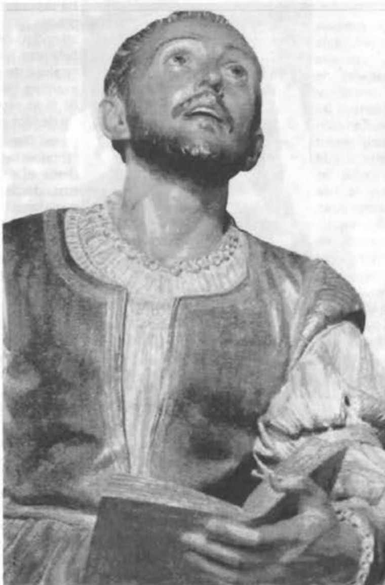
SAN IGNACIO DE LOYOLA EN SU CONVALECENCIA, LEÍA VADAS DE SANTOS Y MEDITABA

discípulos y discípulas. De Jesús nos sorprende su poder de transgredir leyes, las instituciones —por ejemplo la familia patriarcal—, para poner por encima de todo los deseos de Dios. También nos llama la atención su poder de atracción y fascinación que le lleva a formar un grupo de discípulos y discípulas, desde una perspectiva muy incluyente.