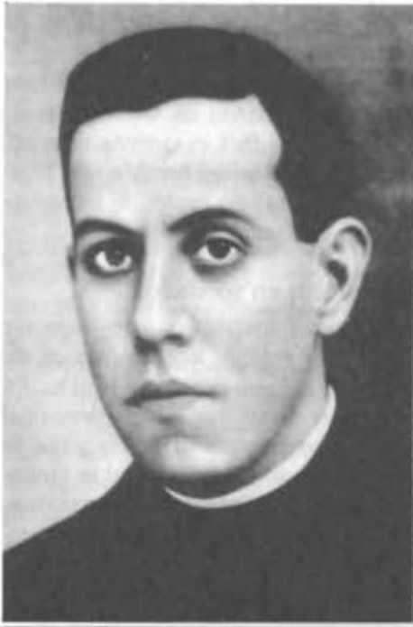
BEATO MIGUEL AGUSTÍN PRO, fusilado en México el 23 de noviembre de 1927

Este concepto de frontera, íntimamente relacionado a la migración, ha sido el corte vivencial de mi dimensión del Reino como consagrado. No todos pueden entenderlo, sino aquéllos a quienes se les ha concedido entenderlo.