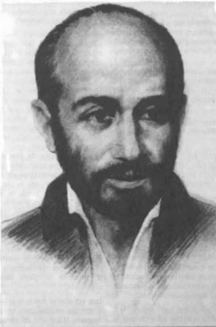
SAN IGNACIO DE LOYOLA FUNDADOR DE LA COMPAÑÍA DE JESÚS

Desde luego no fue un proceso corto ni que haya comenzado muy pronto. Y aun después de comenzado y de que se fuera realizando dentro de mí, tomé conciencia de él poco a poco, primero confusamente y luego con claridad.