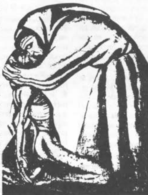
SAN FRANCISCO BESANDO A UN LEPROSO

Indirectamente constituye una denuncia profética de los casos en los que la propaganda pretende convertir el placer sensual en la única o más valiosa manifestación de la relación de pareja; estrategia ligada a diferentes maneras de manipulación y explotación sexual que son regenteadas con gran éxito por poderosos intereses económicos.☒