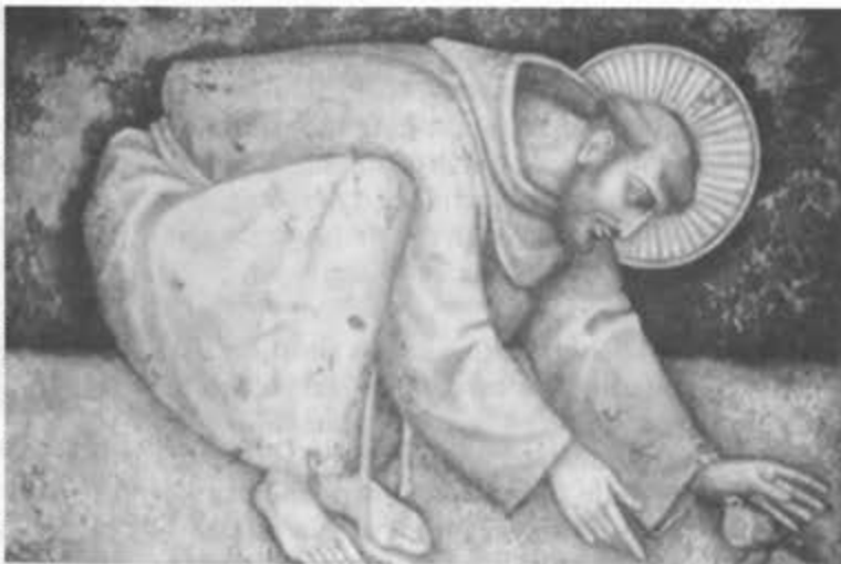
SAN FRANCISCO cuida la vida

«Todos los hermanos que son constituidos ministros y siervos de los otros hermanos, distribuyan a éstos en las provincias y lugares donde estén, visítenlos frecuentemente y ánimenlos espiritualmente. Y todos los otros mis benditos hermanos obedézcanles prontamente en lo que mira a la salvación del alma y no está en contra de nuestra vida. Todos los hermanos que están bajo los ministros consideren razonable y atentamente las conductas de los ministros y siervos; y si vieren que alguno de ellos se comporta carnal y no espiritualmente en conformidad con nuestra vida, y, que, después de una tercera amonestación, no se enmienda, denúncienlo. Y si entre los hermanos, estén donde estén, hay alguno que quiere proceder según la carne y no según el espíritu, los hermanos con quienes esté amonestenlo, instrúyanlo y corrijanlo humilde y diligen-