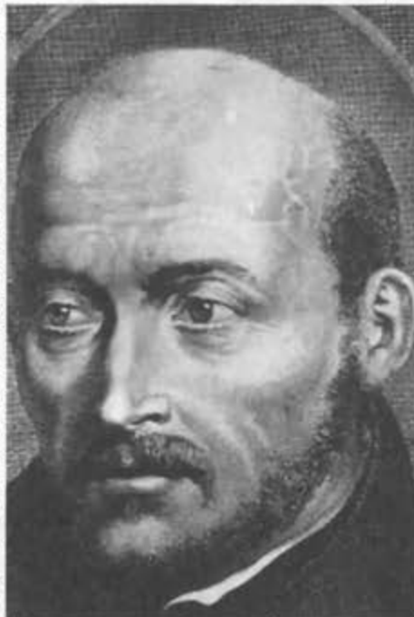
SAN IGNACIO DE LOYOLA PREPÓSITO GENERAL DE LA COMPAÑÍA DE JESÚS