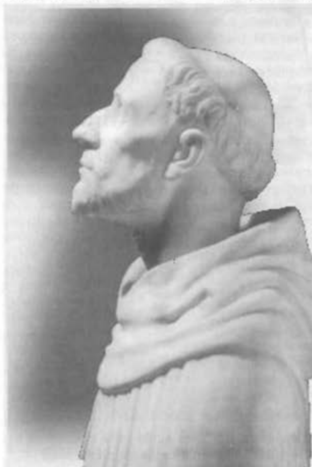
SANTO DOMINGO FUNDADOR DE LA ORDEN DE PREDICADORES

El irrumpir de Dios en la historia de alguien tan definido como Jeremías, nacido en Anatot, hijo de Jelcías, durante el reinado de Amón, de la tribu de Benjamín y bajo la sombra de la capitulación de Je-