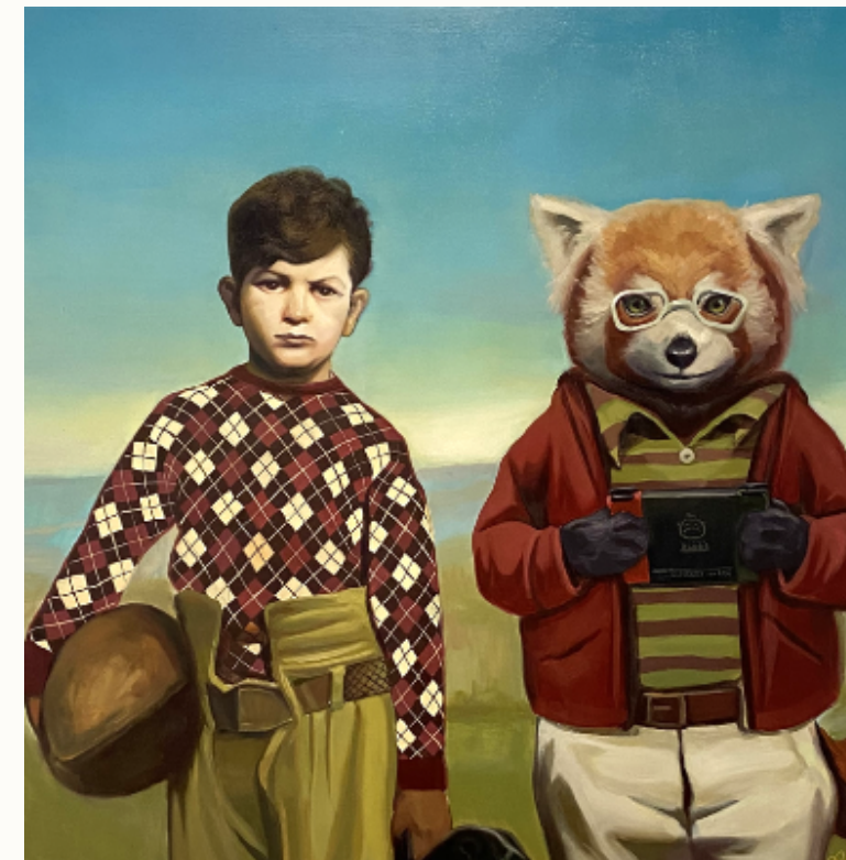
Mis gustos opuestos 2023