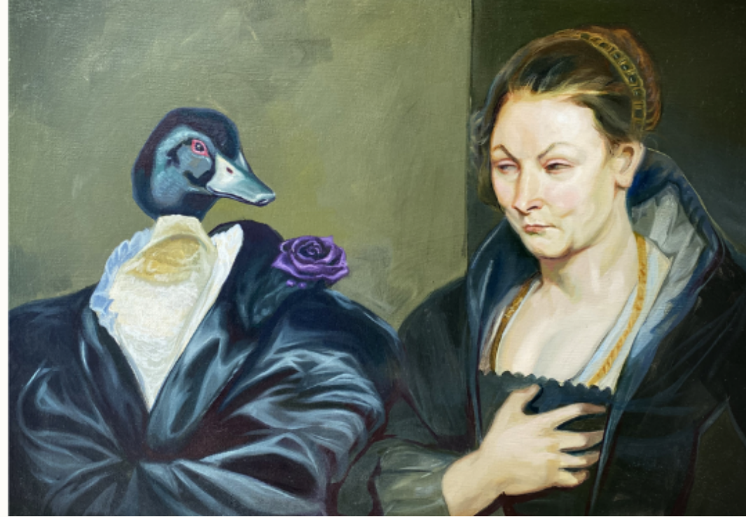
Lady Quack y Celostina 2023