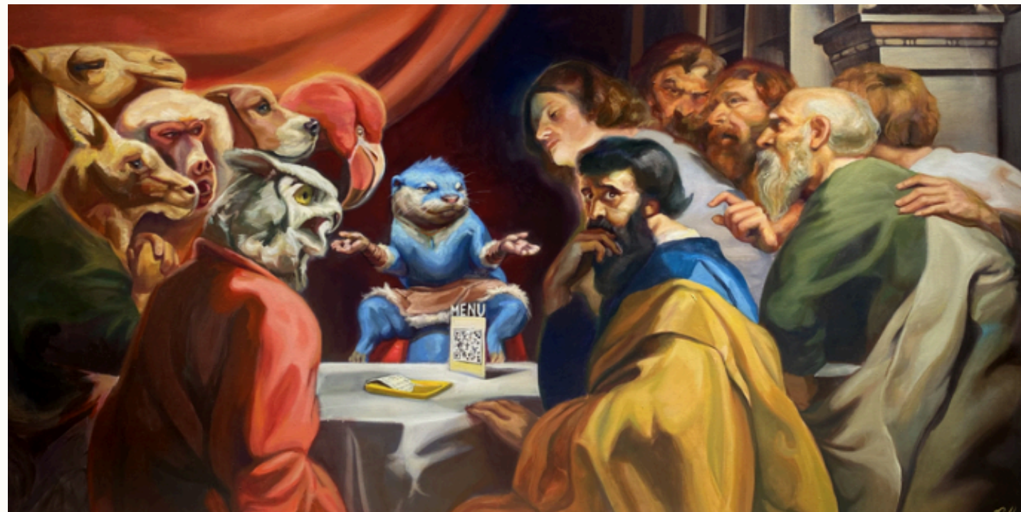
La última cena 2023