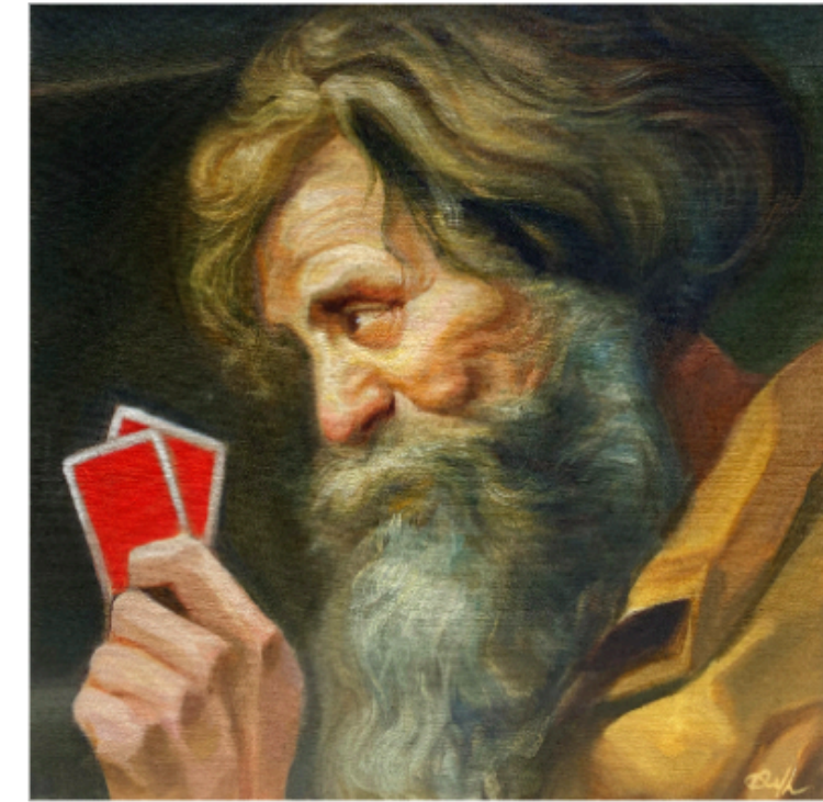
La casa siempre gana (2/2)