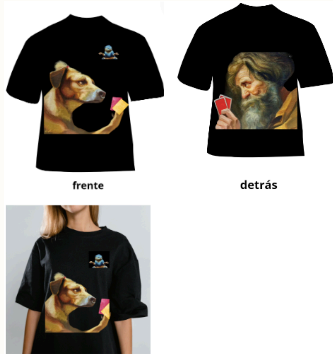
Boceto de propuesta para playeras de marketing. Solorio, A. (2024).

Playeras y hoodies con obras impresas del artista.