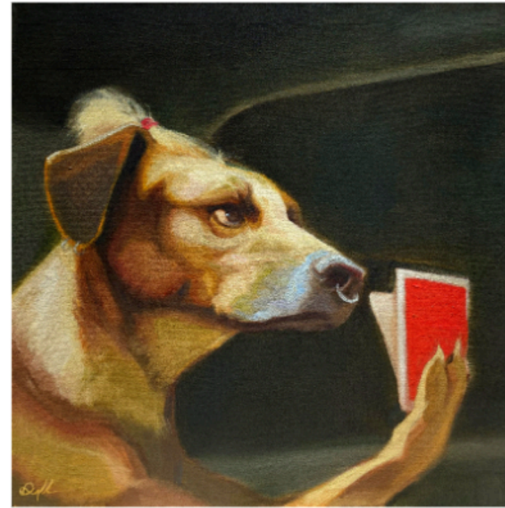
Por un perro 21 (1/2)