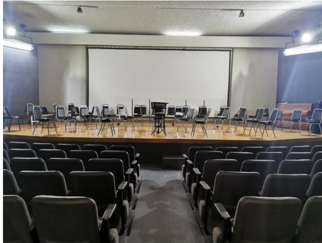
Imagen 17. Auditorio Consuelo Vázquez, Casa de la Cultura Jalisciense.