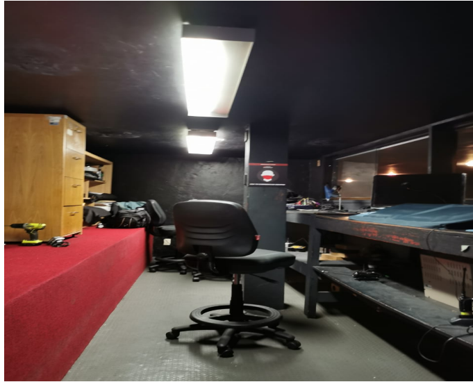
Imagen 9. Cabina del foro.