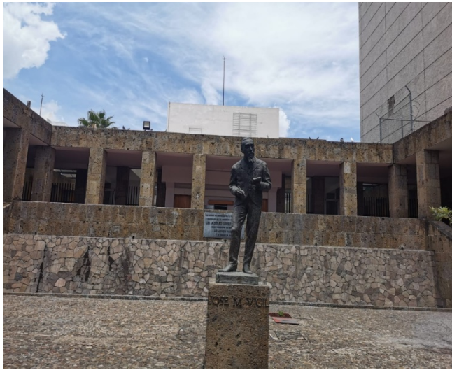
Imagen 16. Patio de la Casa de la Cultura Jalisciense