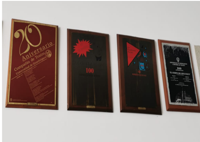
Imagen 13. Placas conmemorativas