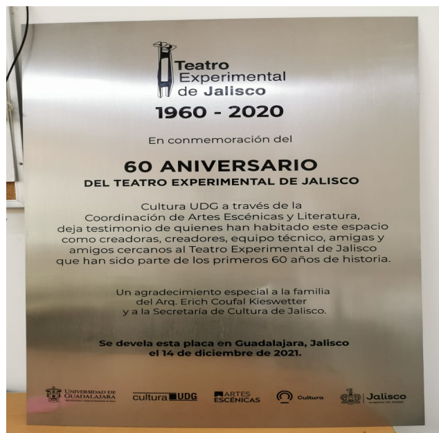
Imagen 6. Placa conmemorativa del sesenta aniversario del Teatro Experimental de Jalisco.