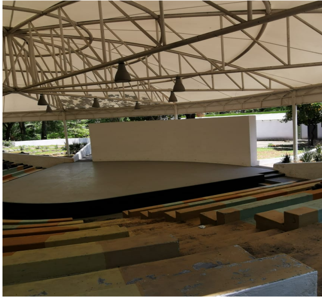
Imagen 15. Auditorio infantil del parque Agua Azul