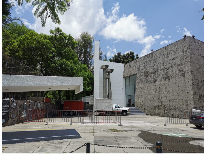
Imagen 1. Teatro Experimental de Jalisco.