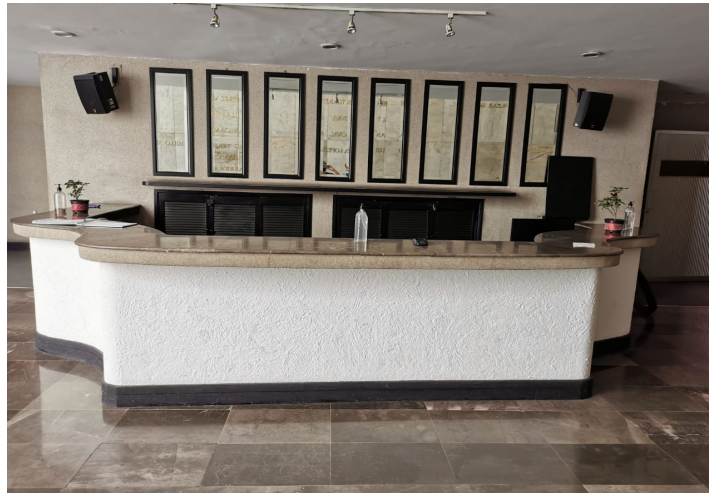
Imagen 3. Recepción.