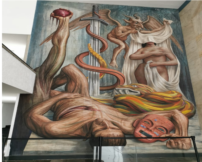
Imagen 5. Mural del vestíbulo; Alegoría al teatro mexicano de Gabriel Flores.