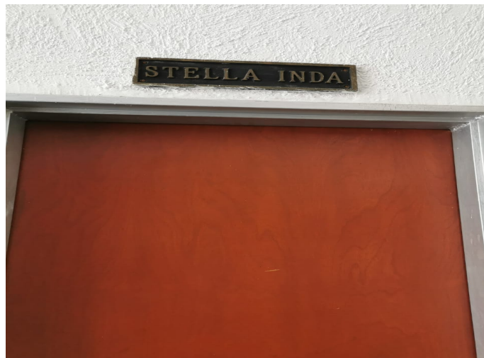
Imagen 12. Oficina Stella Inda