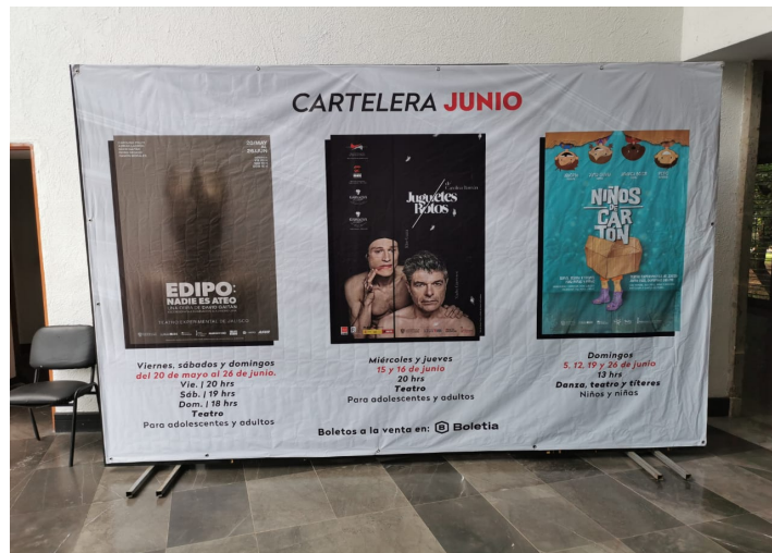
Imagen 4. Cartelera Junio.