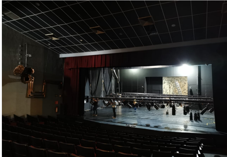
Imagen 7. Foro del Teatro Experimental de Jalisco.