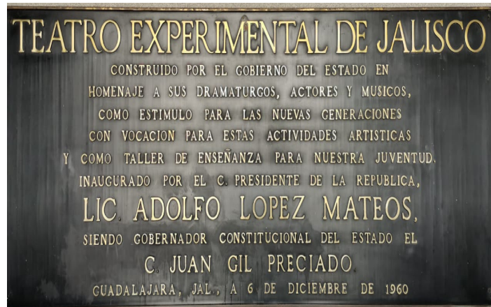
Imagen 2. Placa conmemorativa de la inauguración del Teatro Experimental de Jalisco.