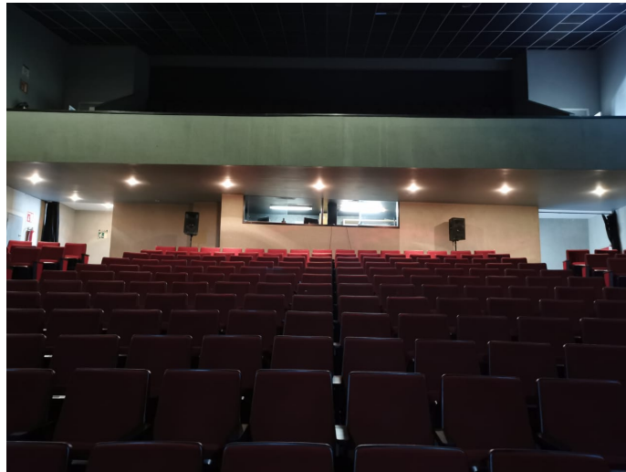
Imagen 8. Butacas.