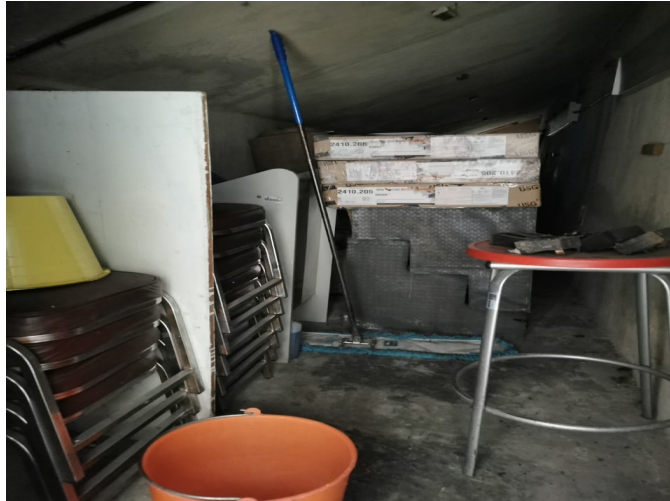
Imagen 11. Bodega del sótano