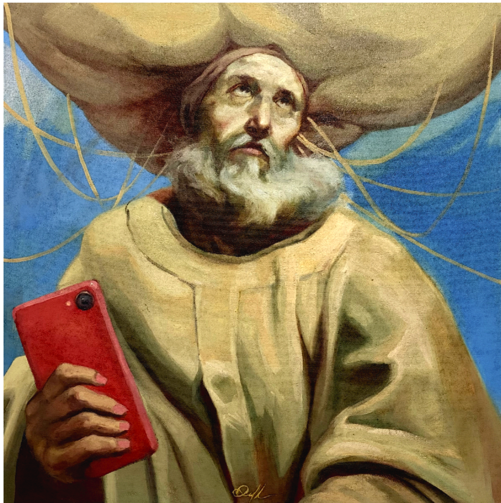
Soltero 2023 Mixta sobre tela 60 x 60 cm Colección privada