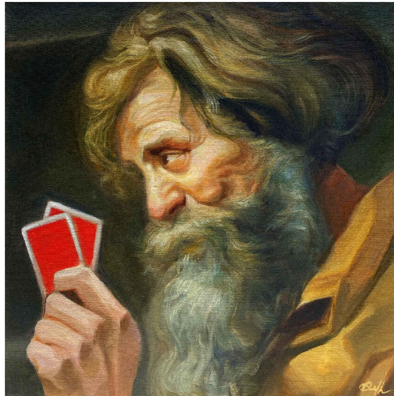
La casa siempre gana (2/2)