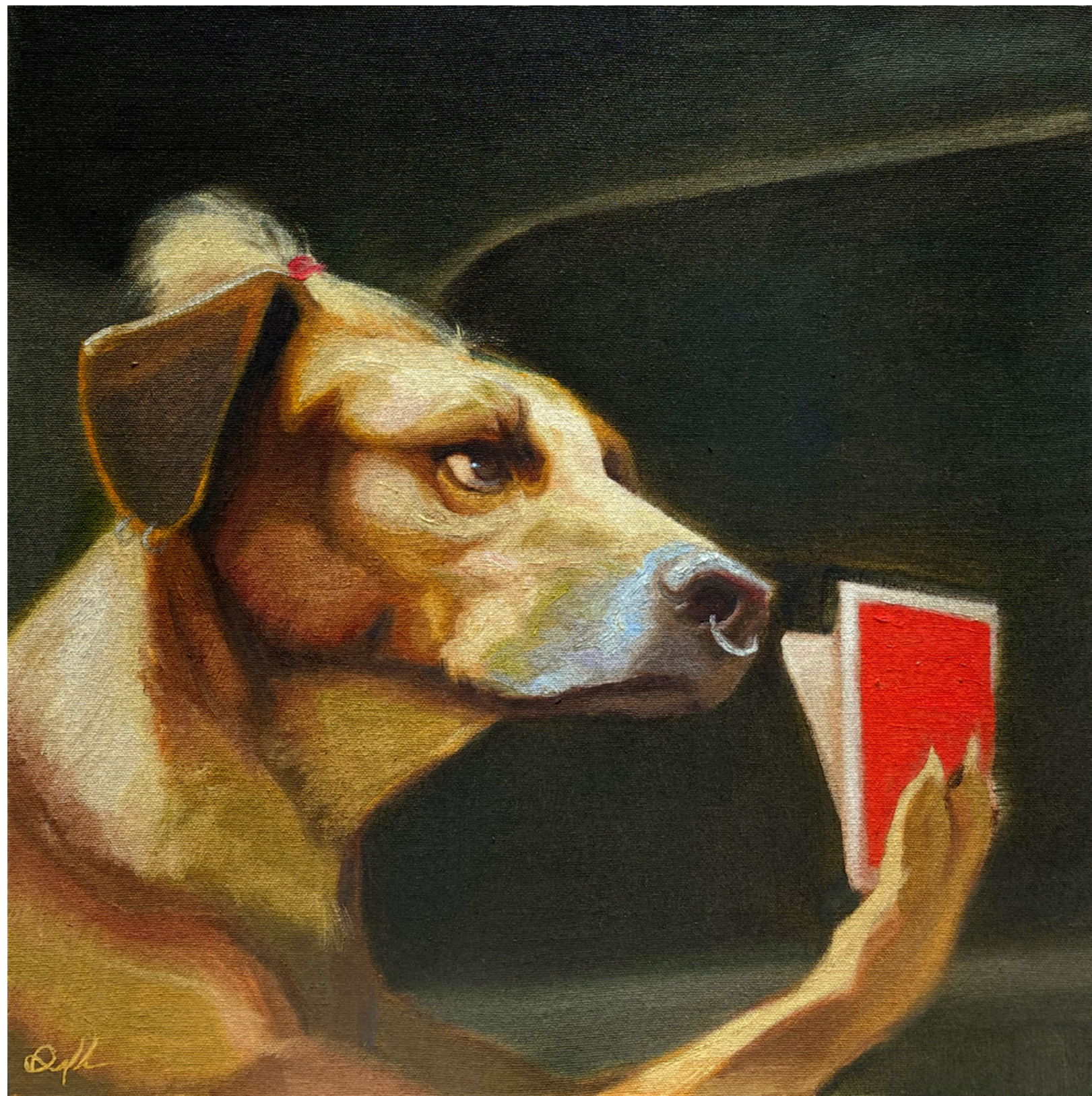
Por un perro 21 (1/2)