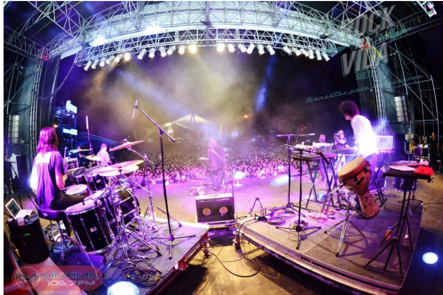
La Barranca, RXLV 7, 2014