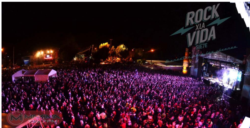
Público RXLV 7, 2014