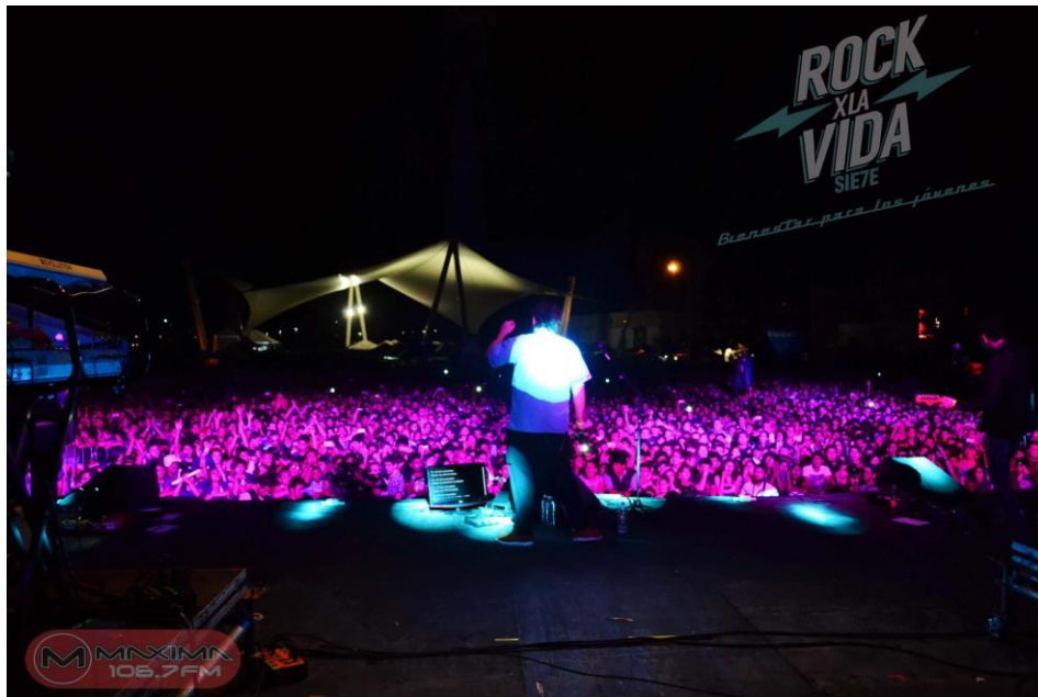
Público RXLV 7, 2014