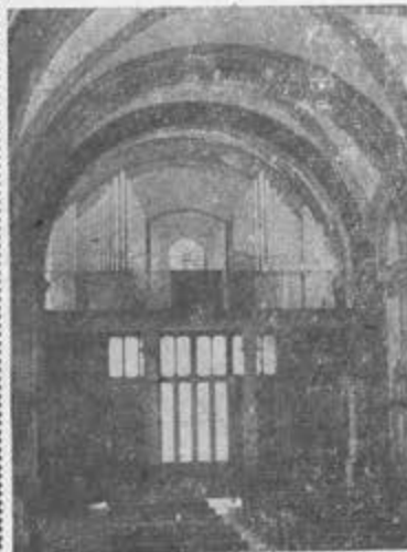
Organo WALCKER instalado en la Parroquia de La Candelaria de Tacubaya en 1953.