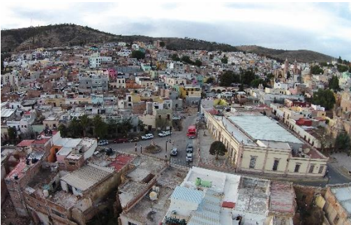
Imagen 3: plazuela del minero y Plazuela de García.

El segundo tipo de áreas de actuación estará destinado a un área que corresponde a algunos de los barrios más representativos y consolidados que se encuentran contenidos dentro del perímetro de protección “B” o de la zona de transición colindante al asentamiento novohispano y que serán previamente seleccionados. Los barrios o colonias en proceso de conformación o transformación, formarán parte del grupo de tercer tipo para la aplicación de las líneas estratégicas.