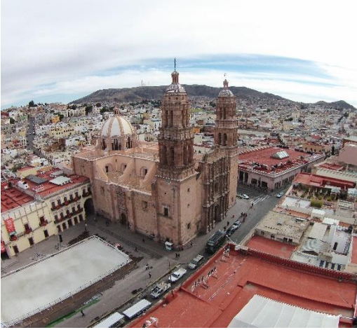
Imagen 2: Catedral y Plaza de Armas.

de este perímetro y que corresponde al sitio del asentamiento Novohispano original busca la unificación en tres núcleos de la estructura urbana, la parte sur, centro y norte, y que sean unidos por medio de un eje lineal peatonal articulador del espacio.