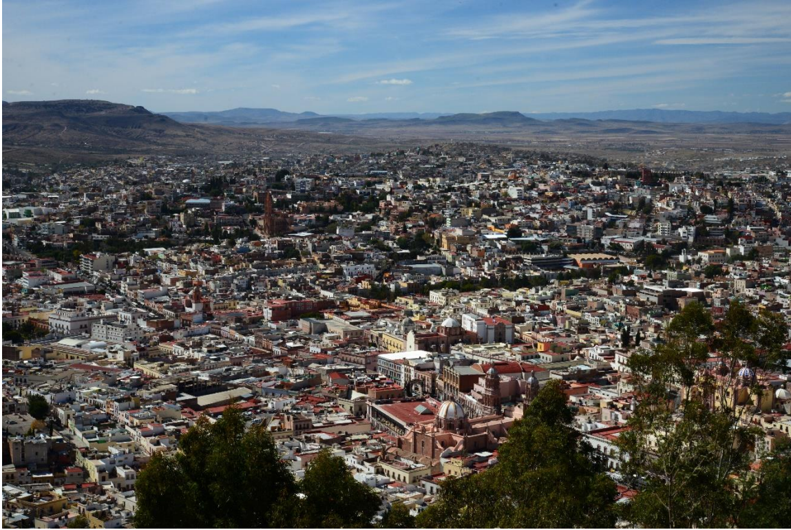
Imagen 1: Ciudad de Zacatecas, Zacatecas, 2015

La ciudad de Zacatecas y su centro histórico en particular han mantenido su centralidad, desde su asentamiento inicial responde a los valores económicos, pero también a valores culturales, sociales y simbólicos que ha ratificado el uso del espacio y su expansión urbana. En el último cuarto del siglo XX esto se afianzó a partir de la adecuación de sus monumentos en equipamiento cultural, la revitalización del espacio público y la incorporación de nuevo equipamiento educativo y de salud, teniendo en la vivienda, comercio y servicios la mayor concentración de usos.