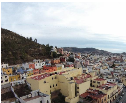
Imagen 4: Vista hacia las faldas del cerro de la Bufa.