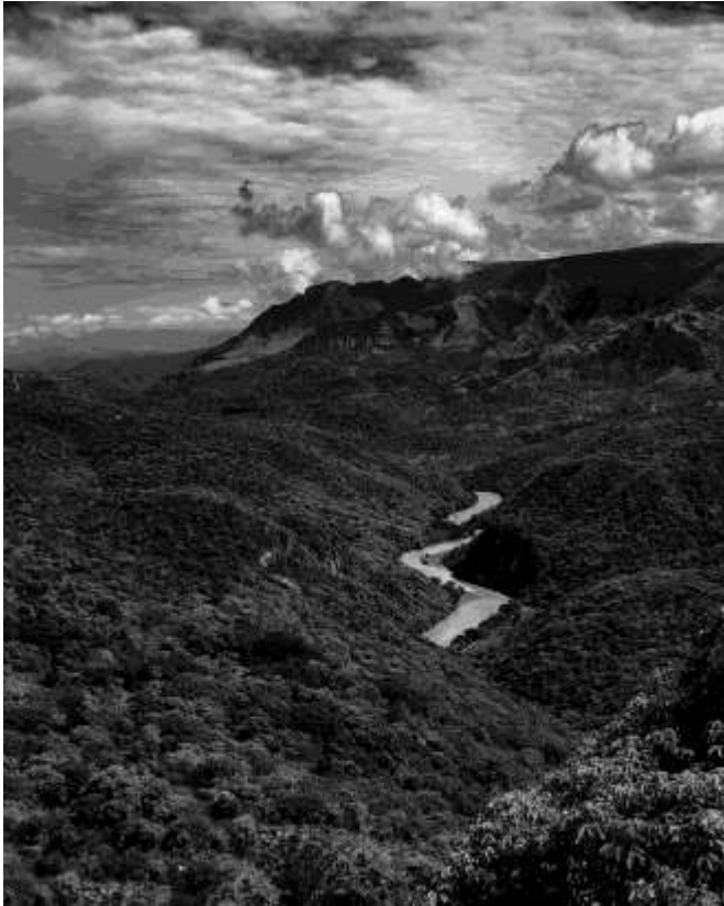
Paisaje de la barranca con el Río Santiago al centro, Jalisco. "Santiago". 12X16 plg. Blanco y Negro.