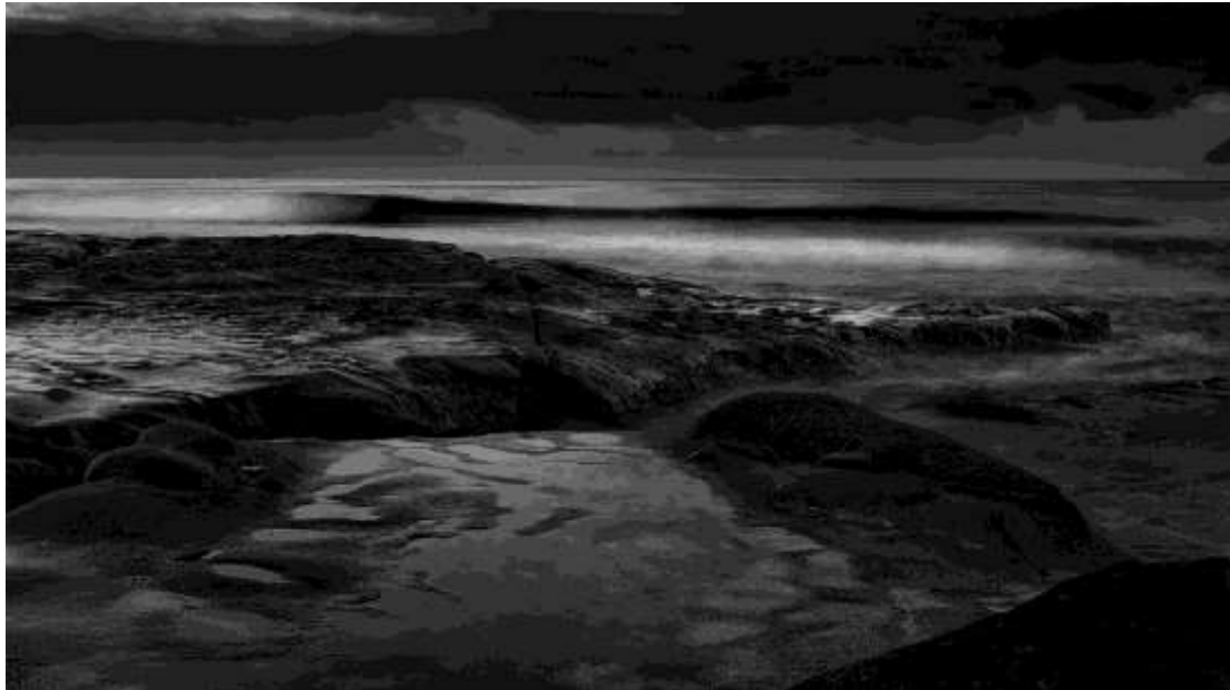
Paisaje de oleaje en una playa rocosa en La Jolla, California. "Calma La Jolla". 28x16 plg. Blanco y Negro.