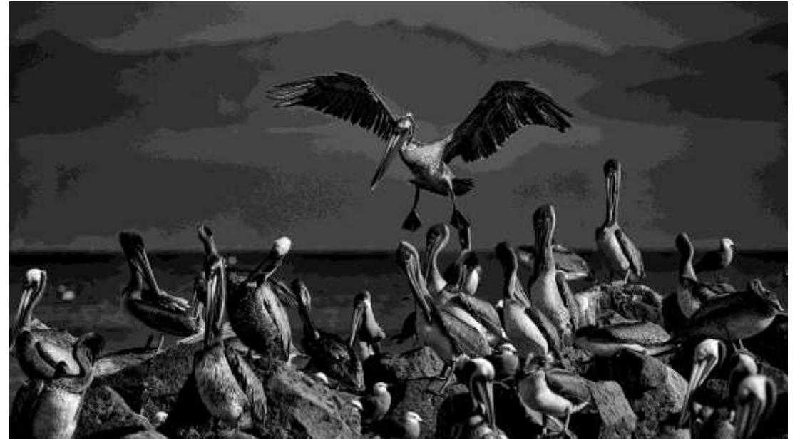
Una parvada de pelicanos con uno llegando con alas abiertas, Punta Mita, Nayarit. "Grupo Pelicanos". 28x16 plg. Blanco y Negro.