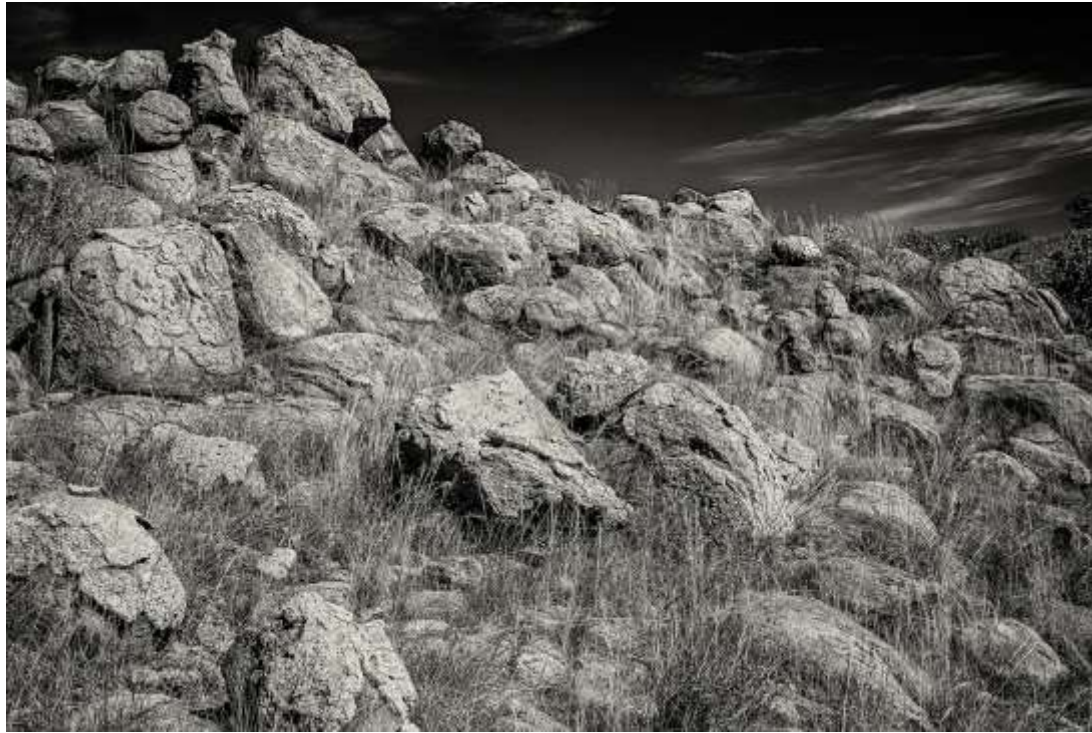
Paisaje rocoso con cielo despejado, Zapopan, Jalisco. "Sendero Fistol". 24x16 plg. Blanco y Negro.