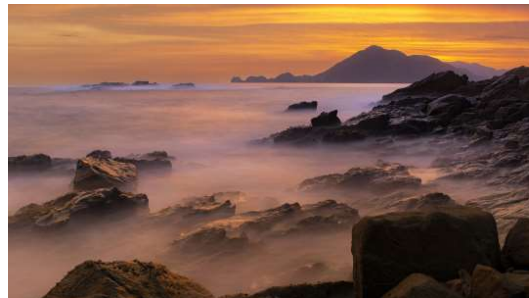
Paisaje de olas en la orilla rocosa de La Punta en Manzanillo. "La Punta". 28x16 plg. Color.