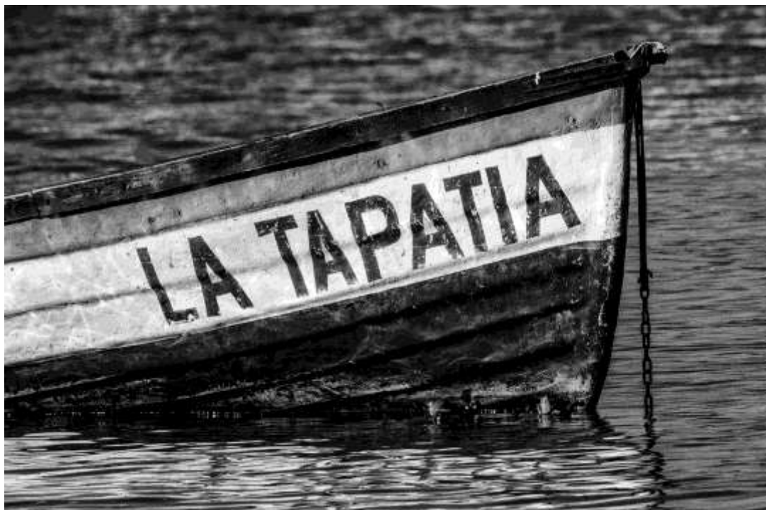
La punta de una lancha en lago de Chapala, Jalisco. "La lancha". 28x16 plg. Blanco y Negro.