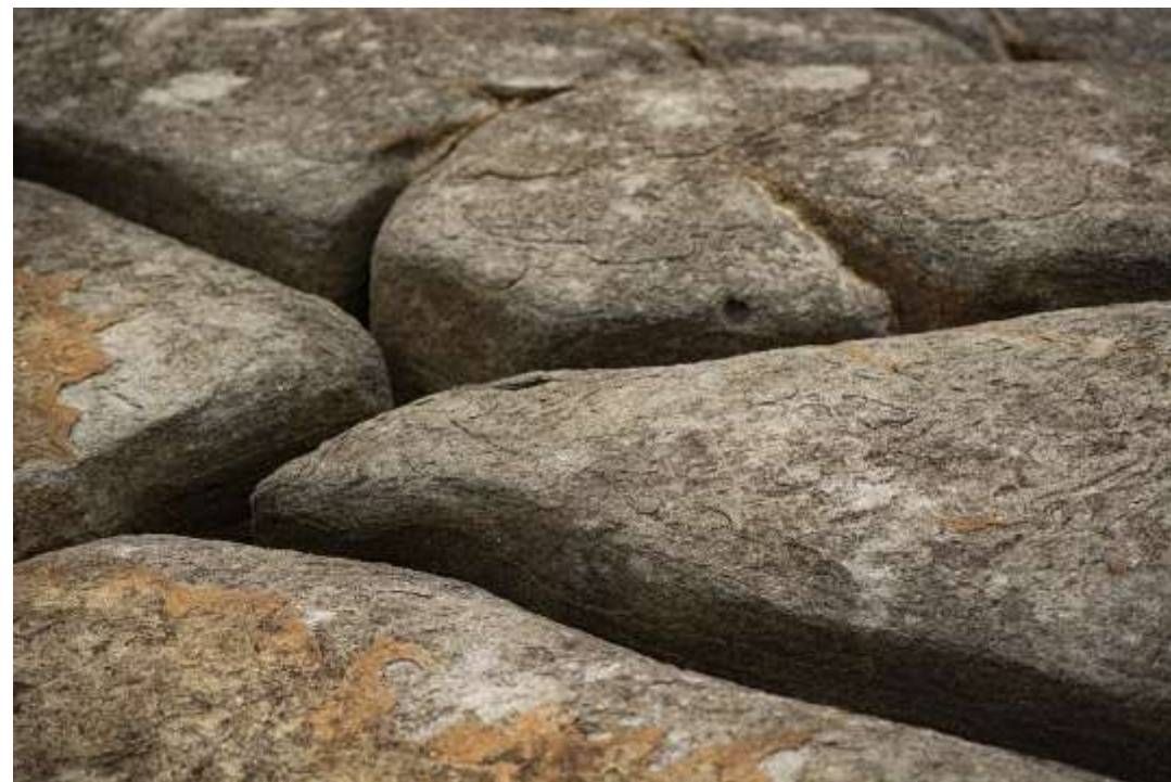
Foto de piedra agrietada por las olas de mar. "Piedras en el mar" 28x16 plg. Color.