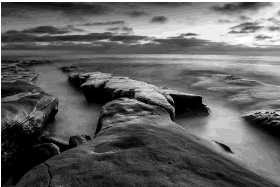
Entrada de mar entre rocas, La Jolla, California. "La California". 24x16 plg. Blanco y Negro.