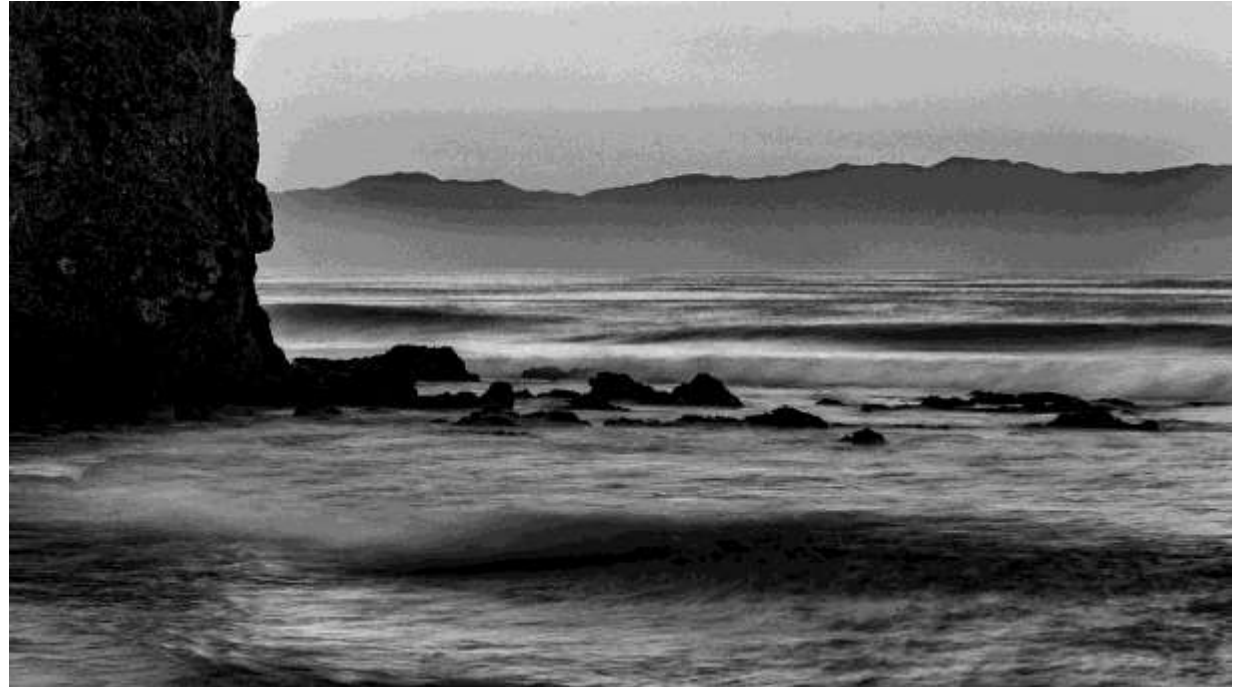
Paisaje del oleaje en un risco rocoso de Punta Mita, Nayarit. "Calma Mita". 28x16 plg. Blanco y Negro.