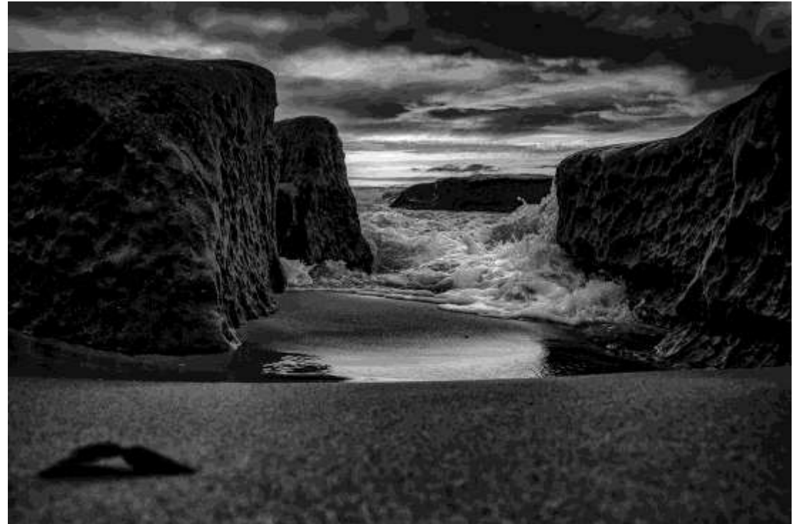
Acercamiento a una ola entrando entre pared de rocas en la playa, La Jolla, California. "La hoja". 24x16 plg. Blanco y Negro.