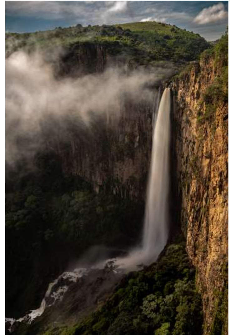
Caída de agua en la Barranca de Huentitan, conocida como cola de caballo. Barranca de Huentital. 16X24 plg. Blanco y Negro.