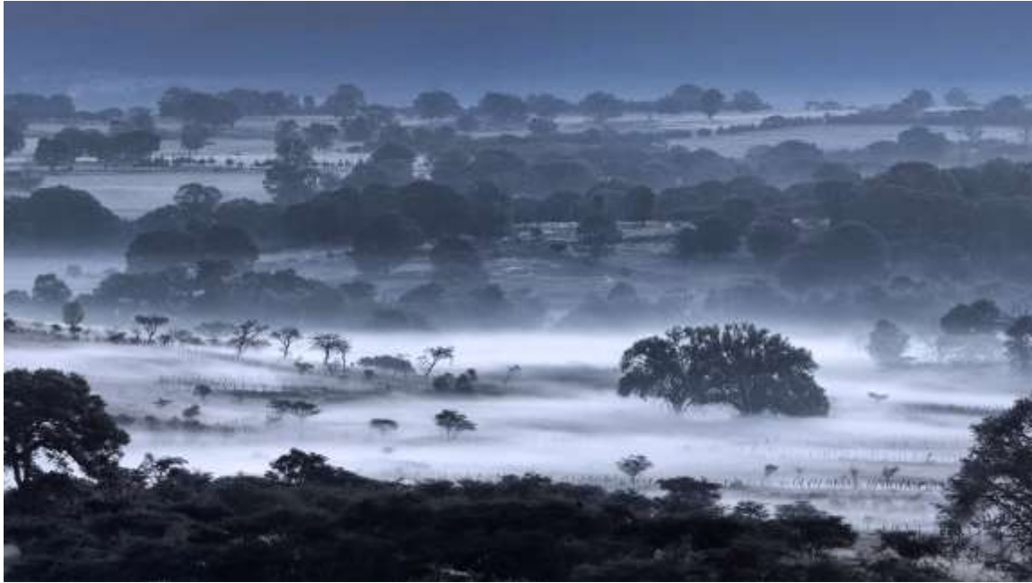
Paisaje con neblina en Quila, Jalisco. "Ni una vaca". 28x16 plg. Color.