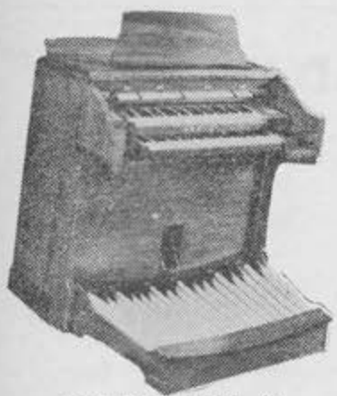
ORGANOS ALLEN, DE AUTENTICO SONIDO TUBULAR.

Al hacer su pedido sírvase hacer referencia a este anuncio y con gusto le haremos un descuento en su compra.