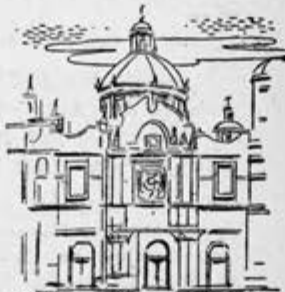
EN LOS ORGANOS "WURLITZER" SE ENCUENTRA LA MISMA CALIDAD Y PERFORMANCIA QUE EN EL ORGANO "WURLITZER" DE LA BASILICA DE NUESTRA SEÑORA DE GUADALUPE

MODELO 44 ALTA FIDELIDAD Diseño de exquisito buen gusto. Ataques instantáneos sin ser explosivos; maravilloso por su completa variedad de registros.