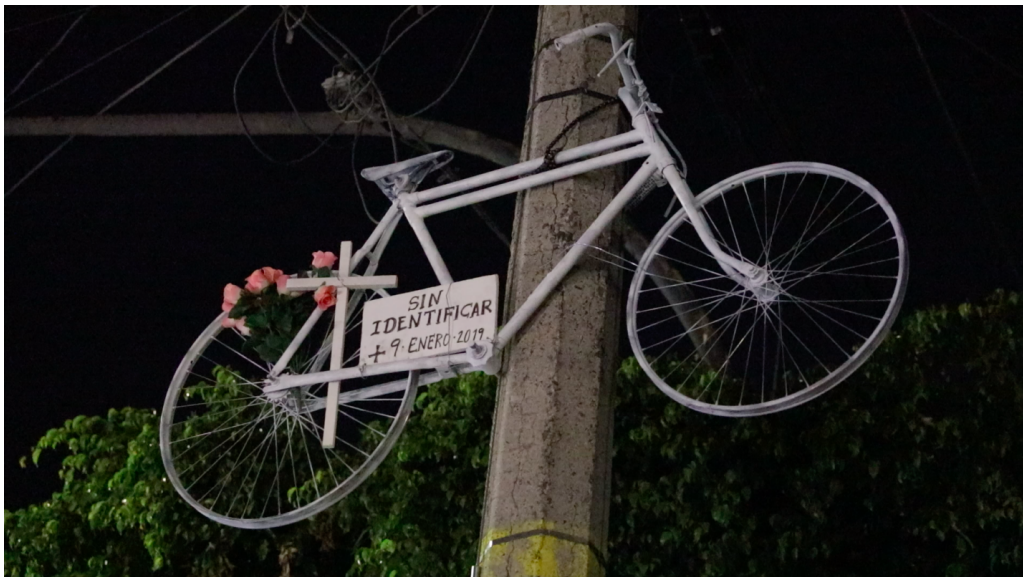
Colocación de Bicicleta Blanca en Calle Dr. Pérez Arce y Pensador Mexicano. Guadalajara, 7 de marzo de 2019.