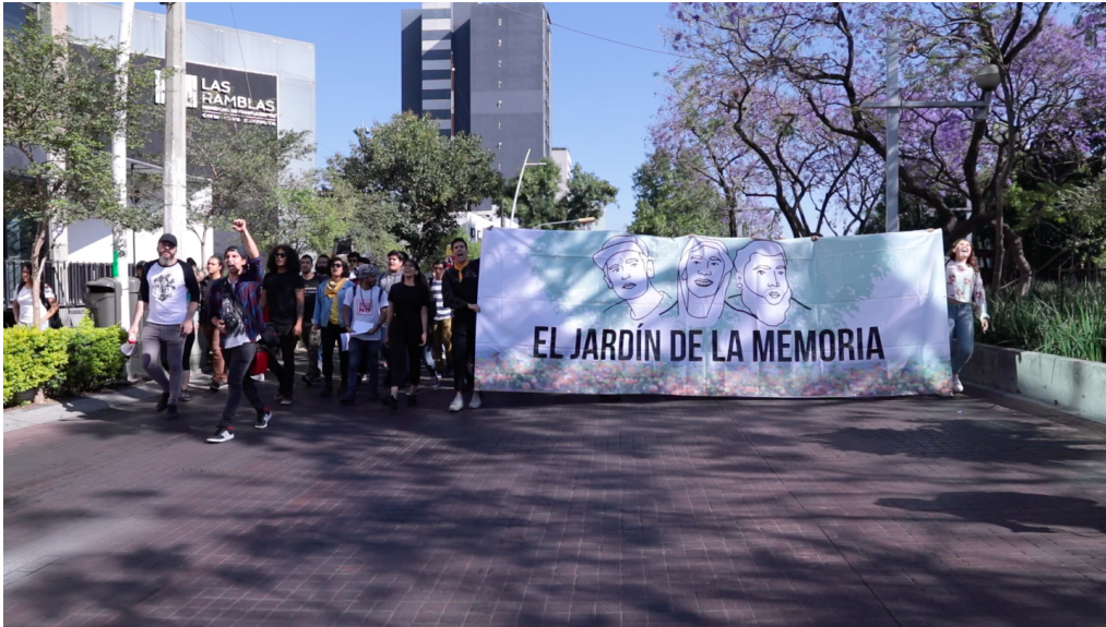
Marcha por los alumnos desaparecidos del CAAV. 19 de marzo de 2019.