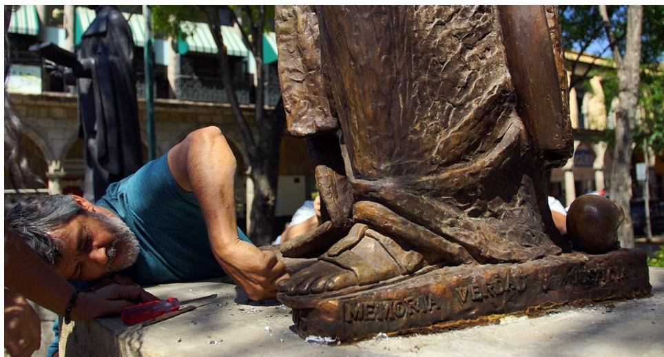
Imagen 4. Fray Antonio Alcalde se pronuncia por los desaparecidos

Escultor y madres develando el mensaje oculto el 19 de marzo de 2019