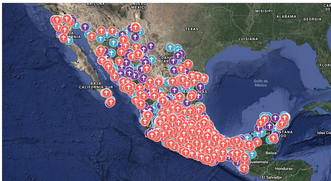
Mapa 1. Mapa de feminicidios en México.

En 2016 se registraron 2,100 casos de feminicidios, en 2017 un total de 2,200, y 1,649 casos en el primer semestre de 2018.