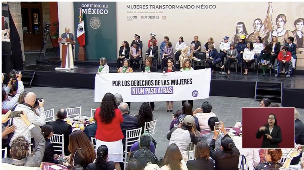
Imagen 5. Conferencia Mujeres Transformando México

Mujeres se manifiestan ante discurso de AMLO en la conferencia del 8M.