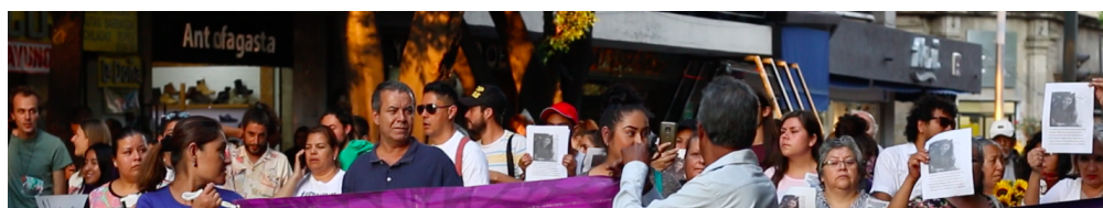
Imagen 1. Marcha 8M

De igual forma, es importante generar mayor acercamiento en cada uno de los temas, buscando un contacto directo con organizaciones, familiares o inclusive víctimas que puedan proveer mayor información al proyecto. Con respecto a la producción audiovisual para el producto final es indispensable continuar con la grabación de los memoriales y asistir a los eventos sociales.