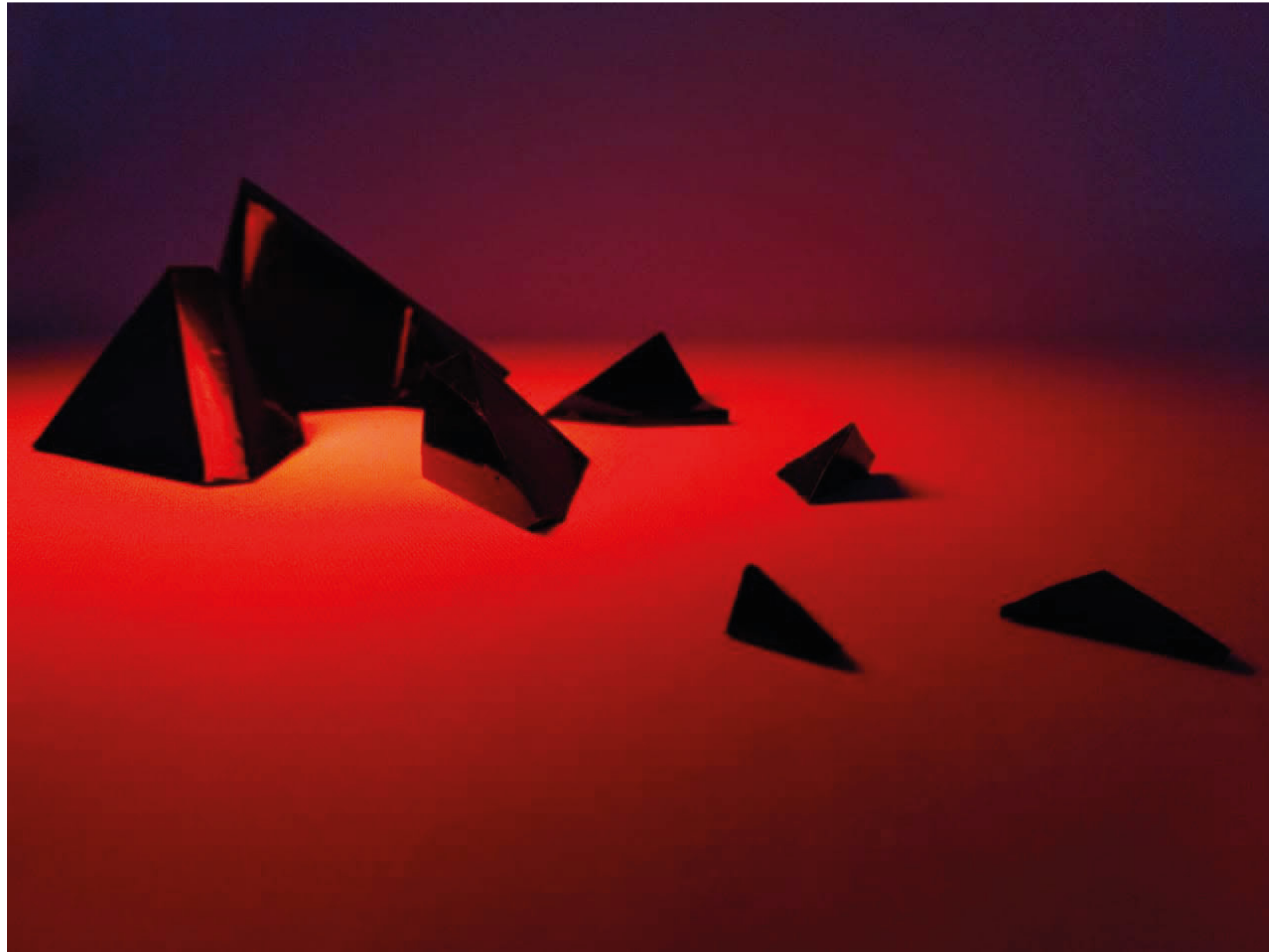
Espacio y Tiempo Fragmentados (2020), 320 x 380 x 280 cm, Maqueta para instalación artística.