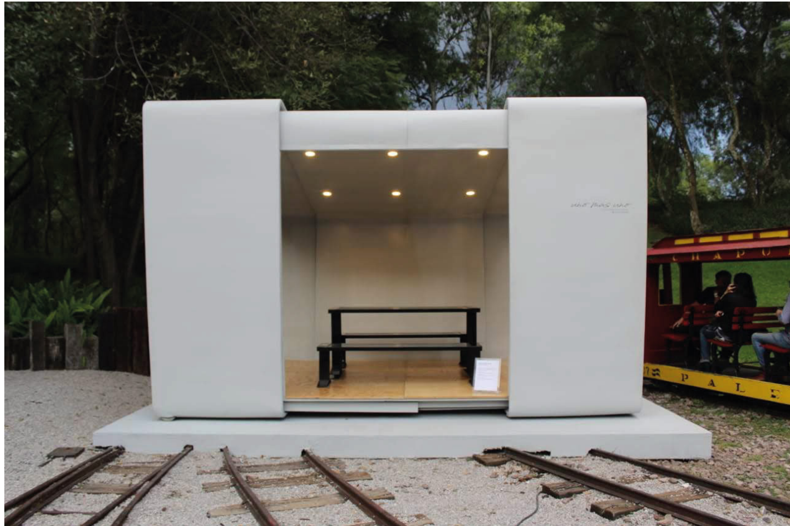
Uno Más Uno - MCEM Ecosistema (2019), 2.44 x 3.60 x 2.80 mts, Módulo de Usos Múltiples para DSGN Week México, Colaboración con Salvador Rodríguez.