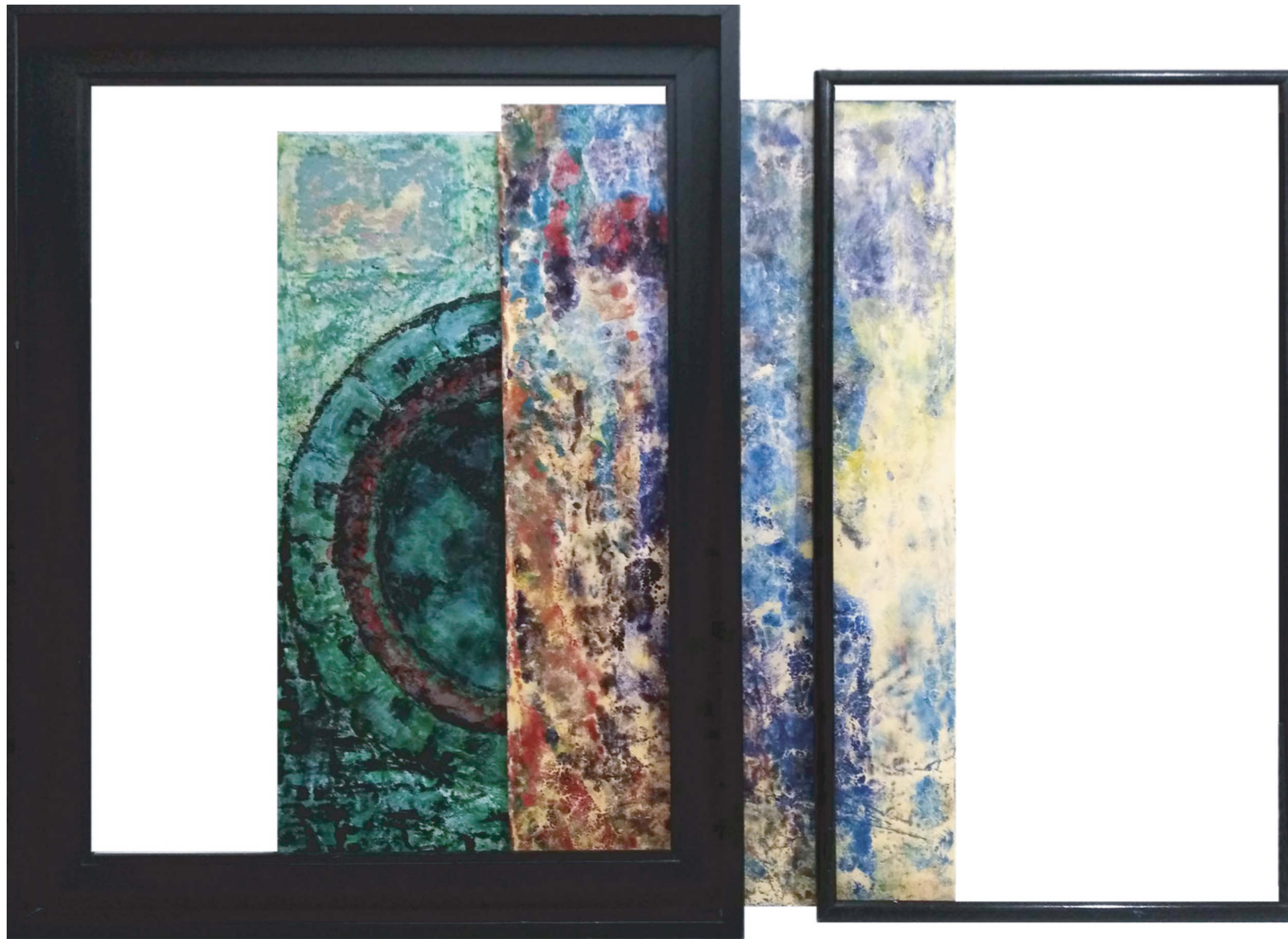
Composición 1 (2010), Políptico 95 x 122 x 20 cm, Encausto sobre madera y marcos.