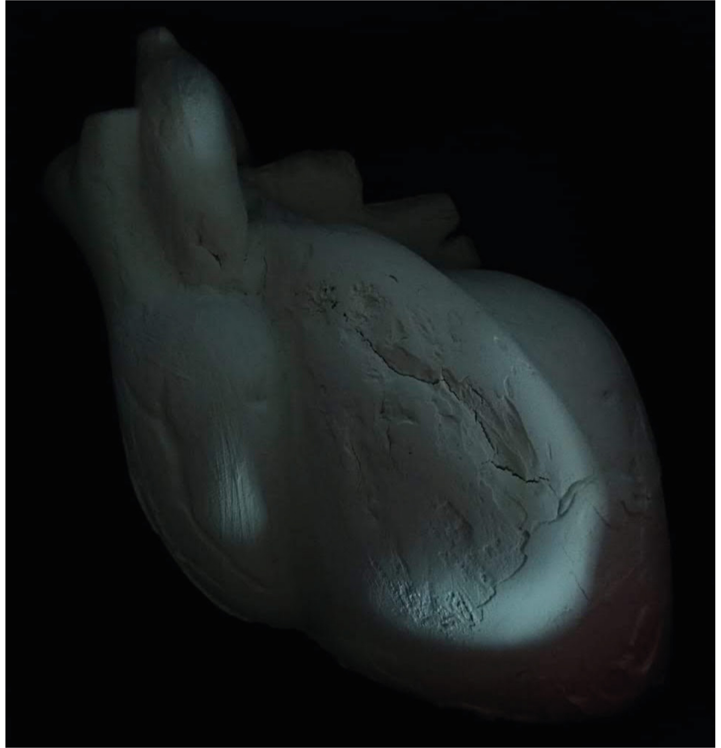
De Corazones Rotos (2020), 21 x 21 x 10 cm, Modelado en pasta.