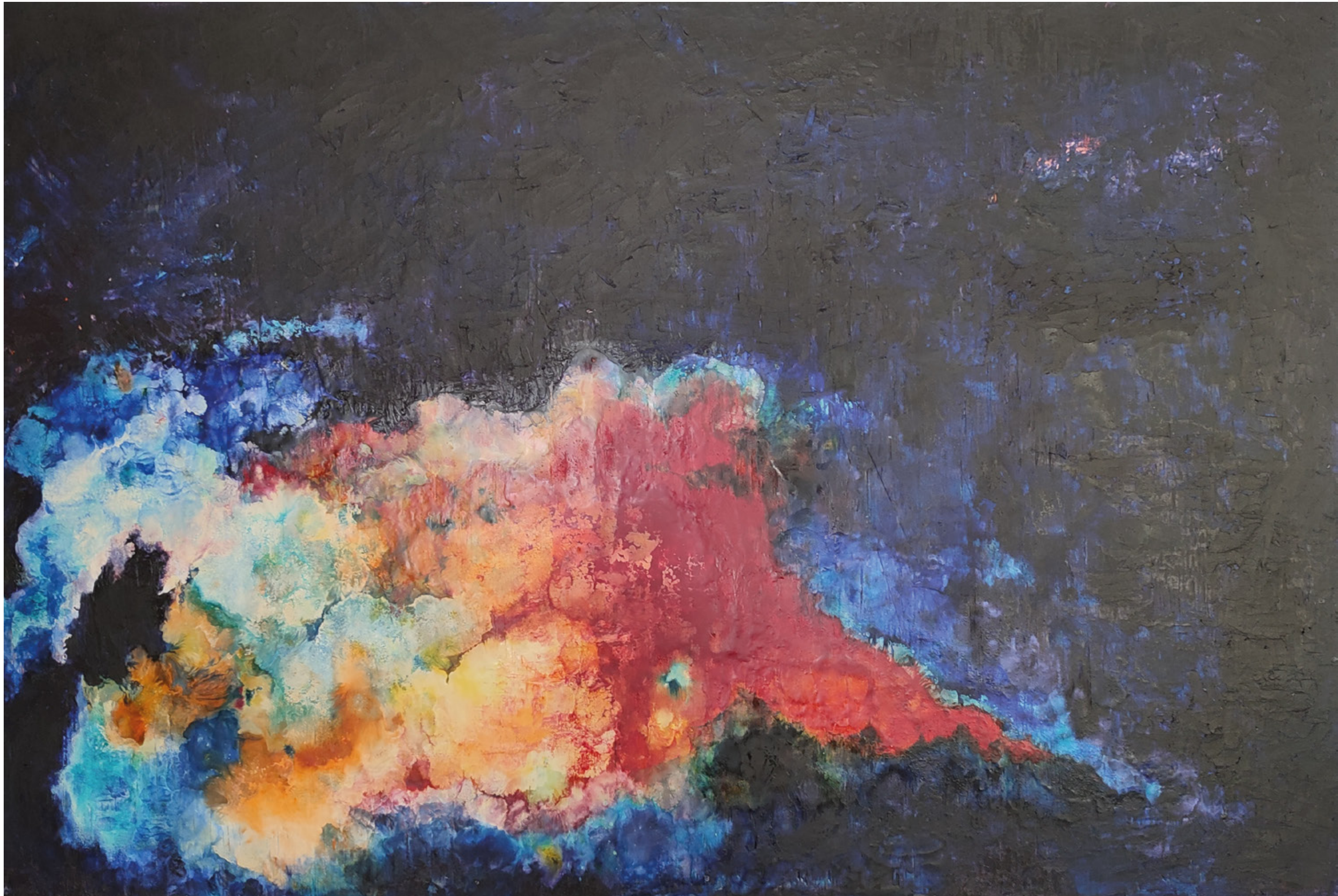
Origen II (2024), 40 x 70 cm, Encausto.