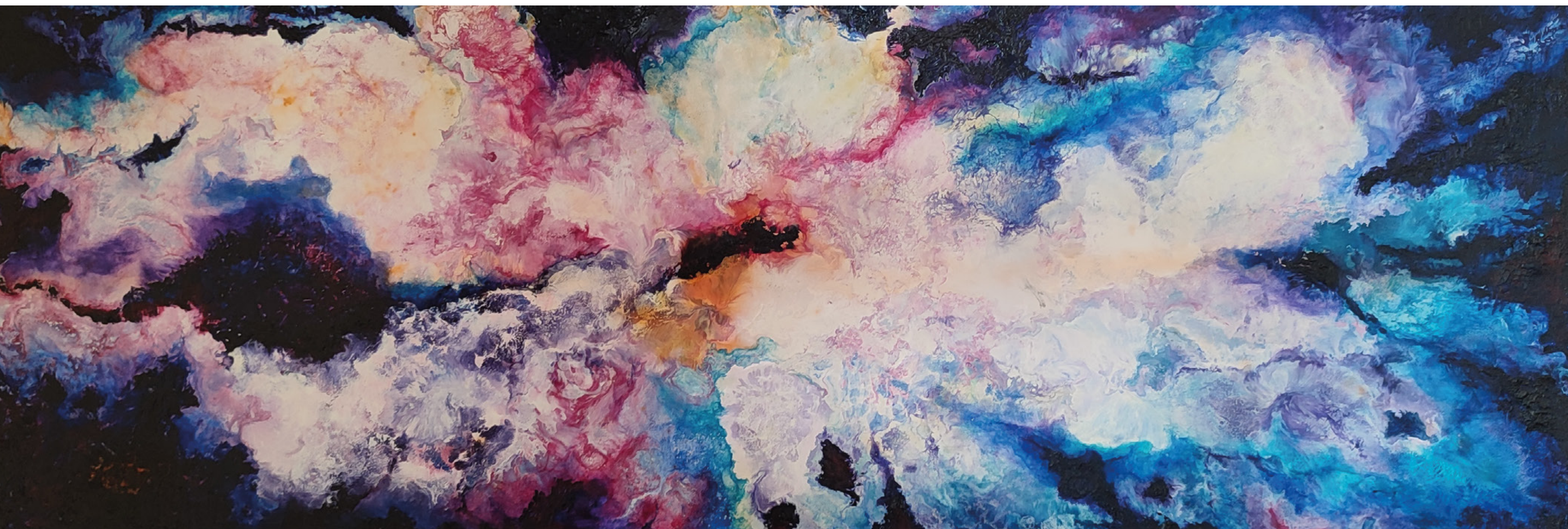
Origen III (2024), 31.5 x 92.5 cm, Encausto.