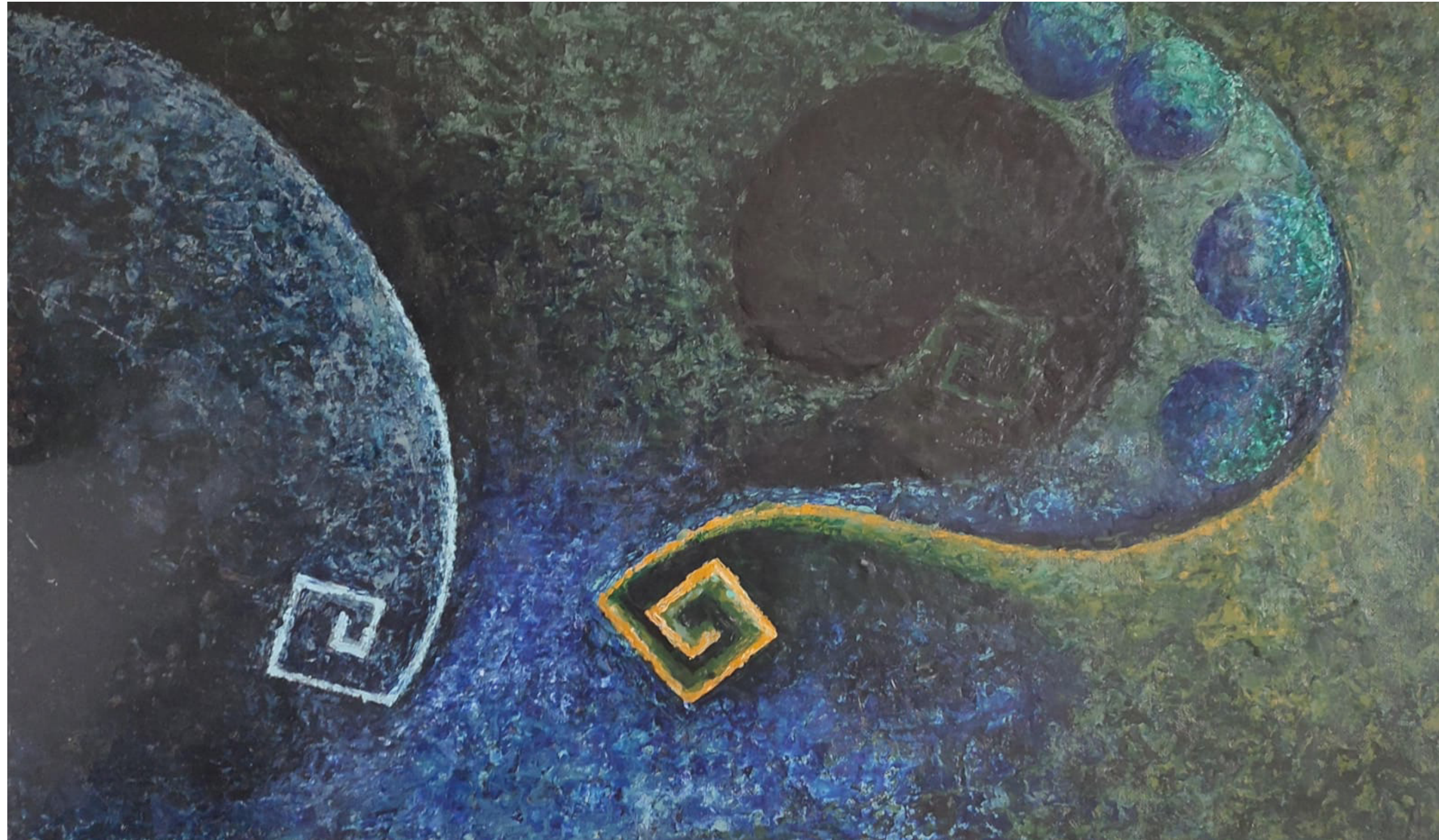
Origen (1996), 71 x 122 cm, Encausto sobre madera y Yute.