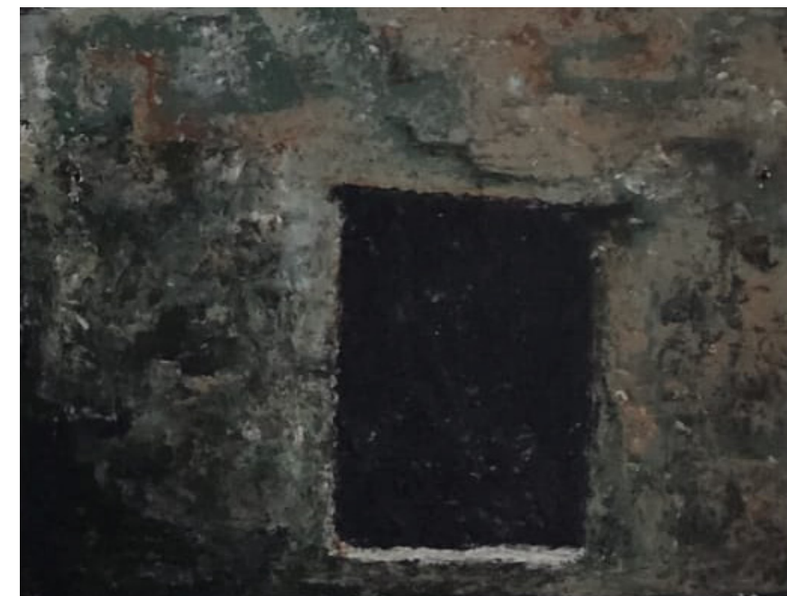
Espacio Transitorio (2000), Díptico: 40 x 30 cm, 16 x 20 cm, Encausto sobre madera.