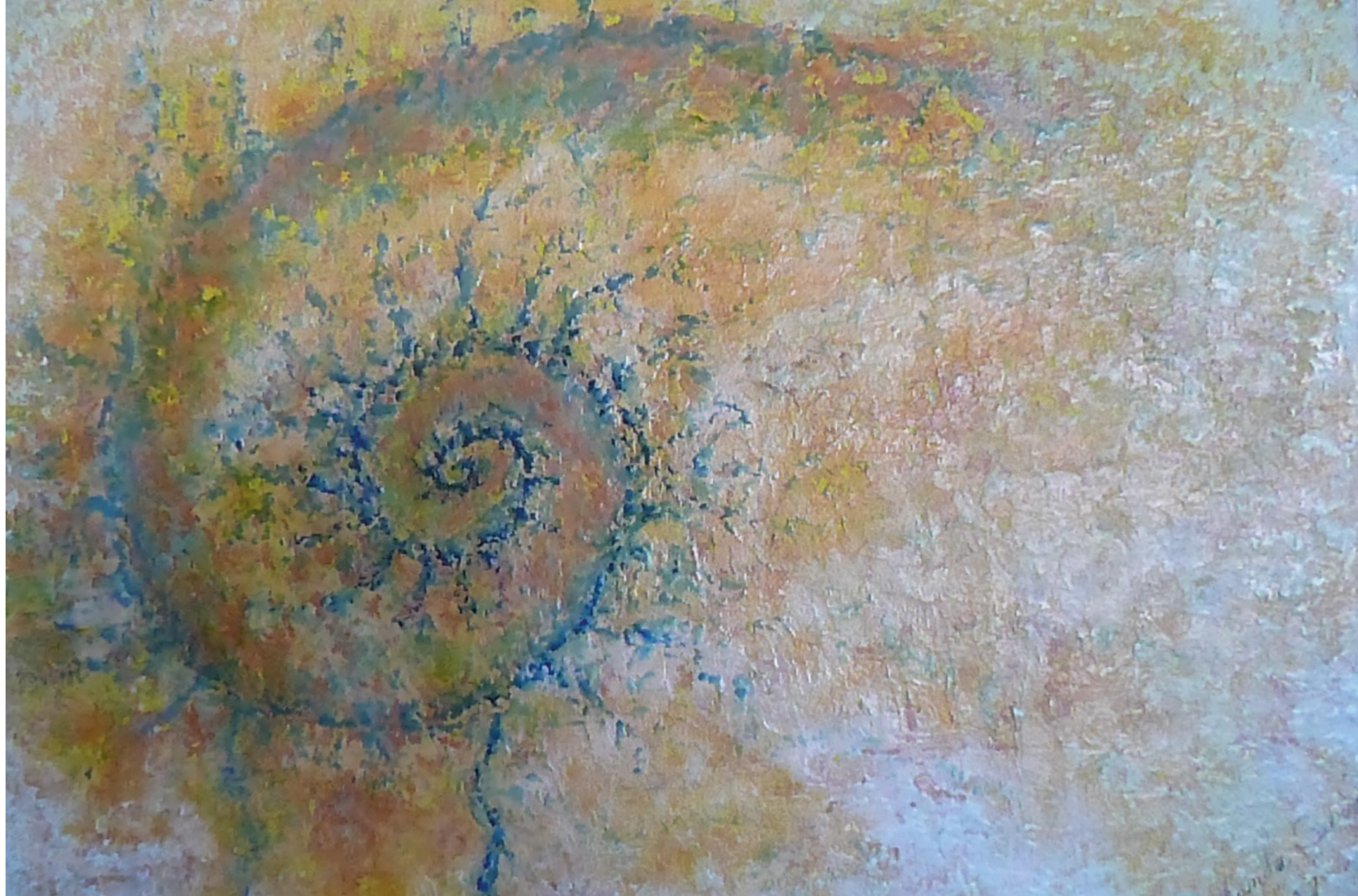
Fractal 1 (2014), 45 x 60 cm, Encausto sobre madera.