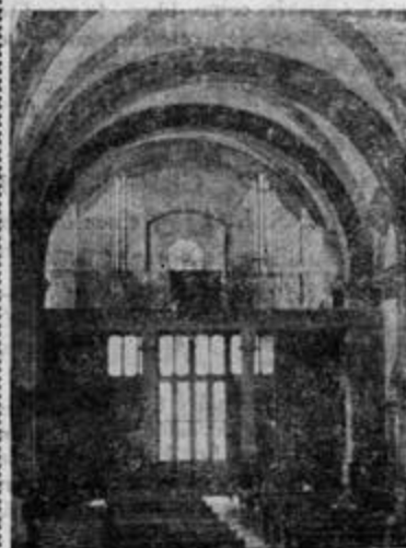
Organo WALCKER instalado en la Parroquia de La Candelaria de Tacubaya en 1953.