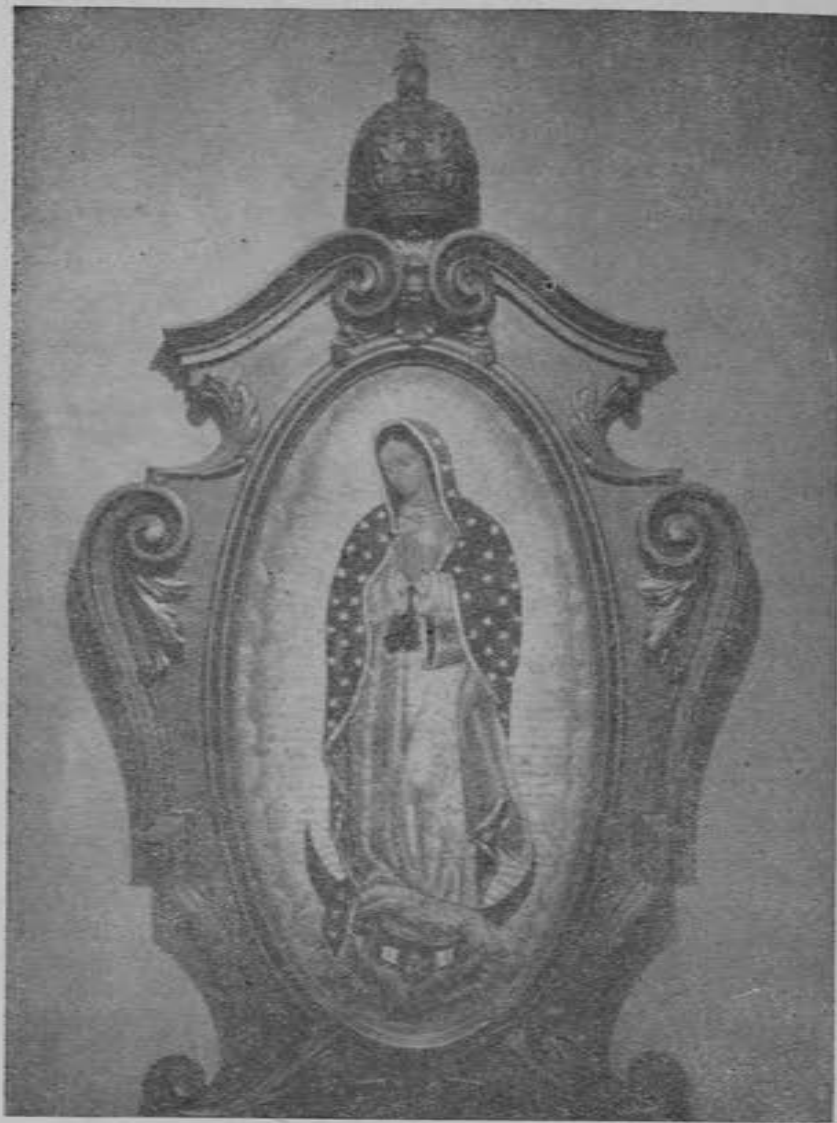
Hermosa Imagen de Nuestra Señora de Guadalupe, hecha en mosaico por un artífice italiano, y venerada en la Capilla del Palacio de Gobierno de la Ciudad del Vaticano.