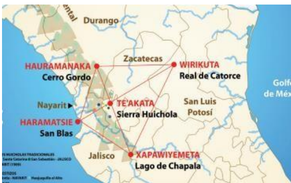
Ilustración 2 Mapa del territorio tradicional wixarika. Fuente: “Territorio tradicional de los huicholes”, Artes de México. Arte huichol , n.º 75, 2005, págs. 10 y 11; y Villegas, Leobardo. “Dioses, mitos, templos, símbolos: El universo religioso de los huicholes”

“Los wixaritari son uno de los cuatro grupos indígenas que habitan el Gran Nayar, en la porción meridional de la sierra madre occidental. Ubicado a ambos lados del cañón Chapalagana, su territorio tradicional abarca porciones de cuatro estados: Jalisco, Nayarit, Durango y Zacatecas” (Nerurath, 2003)