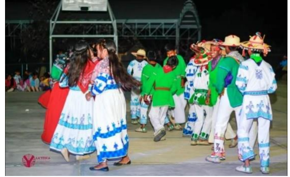
Ilustración 3 fotografía de los y las alumnas de Tei M+ayema, tomada por el gobierno municipal de la Yessca, Nayarit el día internacional de la lengua materna