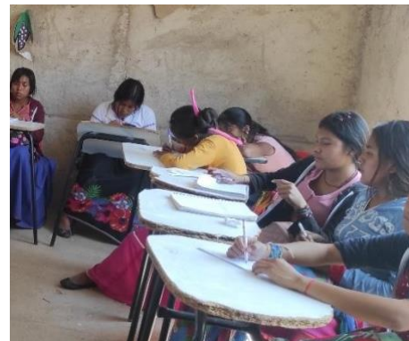
Ilustración 14 ejercicios realizados como el establecimiento de metras y ritual de agradecimiento en la primera sesión del círculo de escucha con las estudiantes de Tei M+ayema

Durante el semestre de otoño de 2023, se ejecutó la elaboración del cuadernillo y la triangulación de información en respuesta a las necesidades identificadas tras la observación