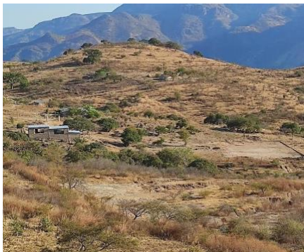
Ilustración 4 telesecundaria intercultural Tei

Tei M+ayema se encuentra a aproximadamente 5 minutos de la casa, al llegar te encuentras con una balla de púas, al entrar a la institución académica te encuentras con un terreno de alrededor 1000m 2 , donde la construcción abarca un aproximado de 100 m 2 . Con un pequeño sendero de tierra que lleva directo a los salones, evitando la mayoría de las rocas y arboles de alrededor del terreno, al lado derecho del sendero, en una parte más elevada esta un tinaco de Rotoplas que es usado por los alumnos