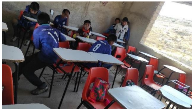
Ilustración 7 aula de primero y segundo de secundaria

El salón este pintado de blanco con el logo de la secundaria pintado en la pared a la que los alumnos le dan la espalda. En los costados hay ventanas, sin cristal, que abarcan casi toda la pared, dejando que corra el viento.