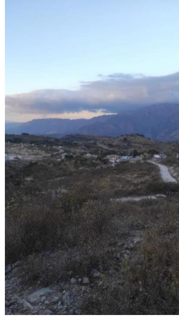
Ilustración 6 fotografía de la comunidad de mesa de chapalilla desde la antena

Una vez pasado el árbol de cuatú el terreno comienza a ser en descenso, que lleva a la cancha de la secundaria que por el momento está hecha de tierra aplanada, alrededor de todo el terreno hay arboles de mango, de guamúchil y cuatú, además hay un sembradío de maíz que parece recién cosechado. Por ser temporada de secas el suelo se ve seco, con la maleza tornada de un color amarillezco.