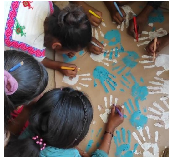
Ilustración 1 estudiantes de Tei M+ayema en ejercicio de sondeo de la identidad y redes de apoyo

Guillermo Bonfil (1990) expone que, en el caso de México, los pueblos originarios sobrevivieron a múltiples intentos históricos de erradicación cultural, sin embargo, siguen existiendo, aunque negados o rechazados por una gran mayoría del pueblo mexicano. Ya el mexicano asume desde una identidad "no india" como resultado de la colonización a la que fueron sometidos los pueblos indígenas. Esto es justo lo que intenta combatir la secundaria intercultural Tei M+ayema, con su enfoque intercultural.