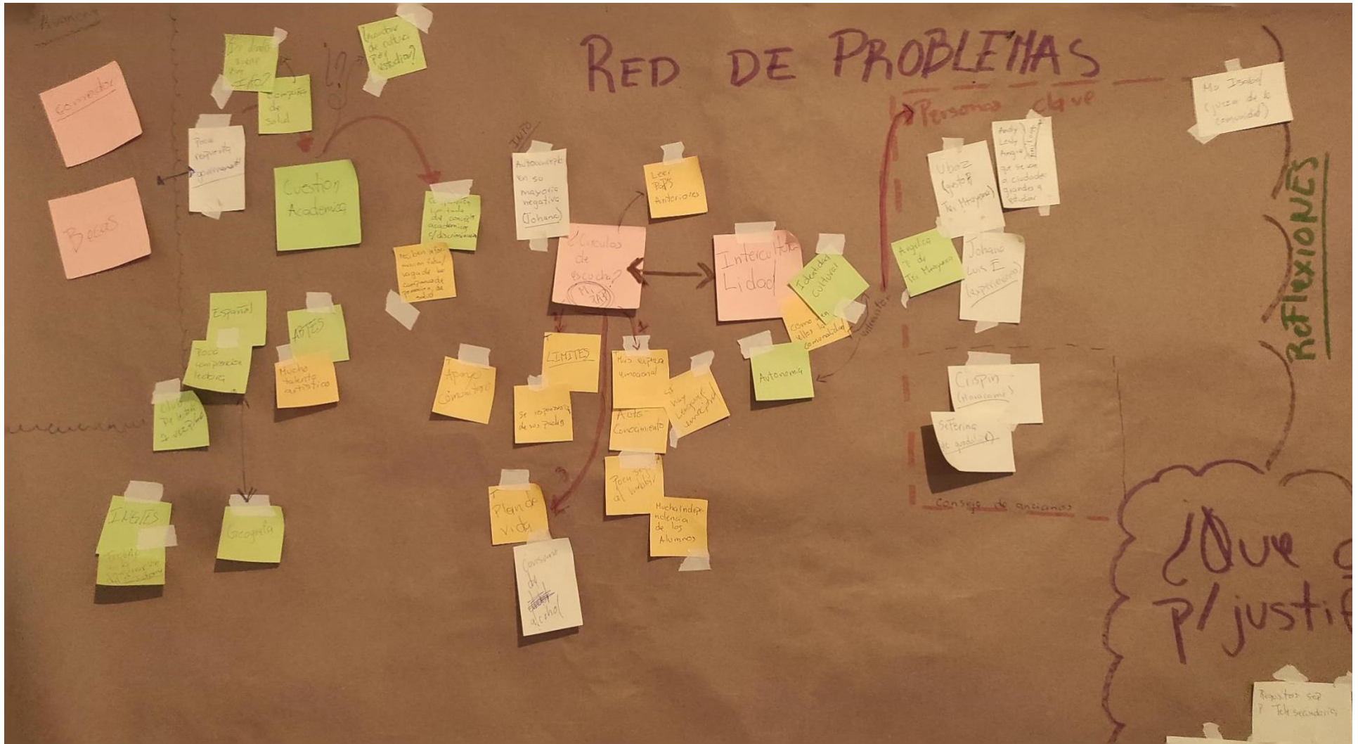
Ilustración 15 red de problemas