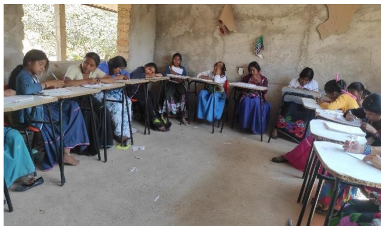
Ilustración 13 sesión 1 del círculo de escucha con las estudiantes de Tei M+ayema

Estos círculos han sido comprobados como ayudas grandes no sólo para los adolescentes sino también para el desgaste emocional de los docentes ya que al generar un sentimiento de comunidad se puede trabajar de una manera más amena y se adquiere un compromiso irresponsable a las actividades académicas.