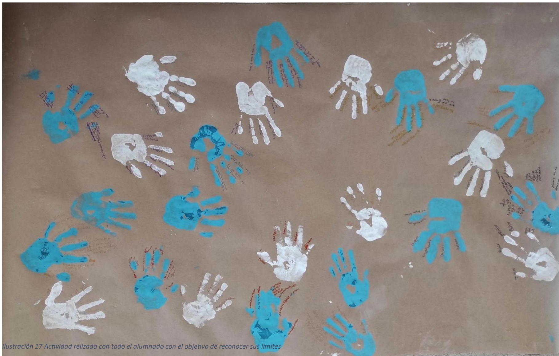
Ilustración 17 Actividad realizada con todo el alumnado con el objetivo de reconocer sus límites