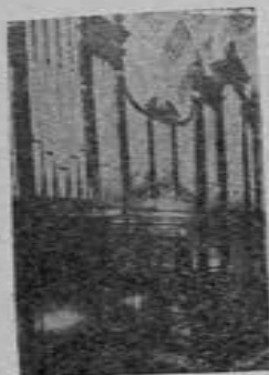
Organo de la Catedral de Mérida, Yuc.