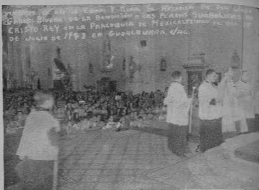
Aspecto de la festividad que se llevó a cabo en la Ciudad de Guadalajara, Jal. con motivo de la bendición de las «Placas Simbólicas de Cristo Rey», por el Excmo. y Rvmo. Sr. Dr. D. José Garibi Rivera, Dignísimo Arzobispo de Guadalajara.

Hallándose el Templo parroquial de Mexicalcingo de la C. de Guadalajara, Jal., completamente lleno de fieles, todos ellos provistos de sus Placas Simbólicas de Cristo Rey, tuvo lugar el día 15 de Julio ppdo. la solemne ceremonia en que se efectuó la bendición de las mismas, conforme se anunció con la debida oportunidad.