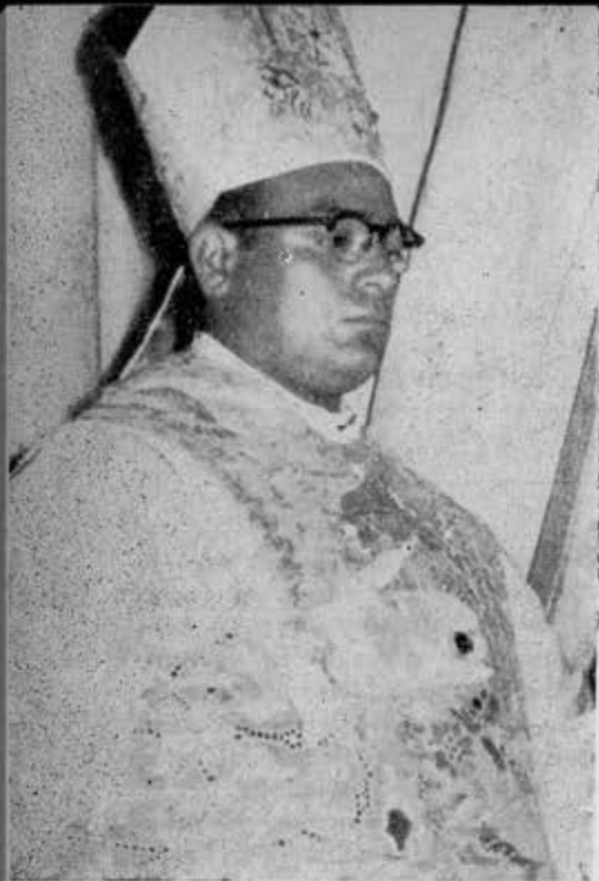
Excmo. Sr. Dr. Dn. Samuel Ruíz García, Obispo de Chiapas.