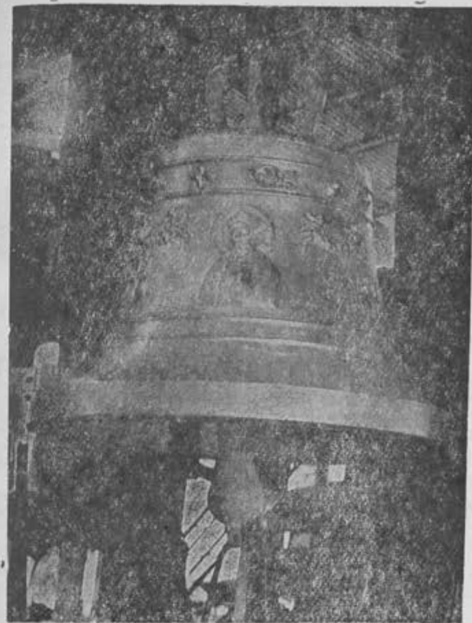
Esta campana fue fundida para la parroquia de la Sagrada Familia, Esq. de Puebla y Orizaba.