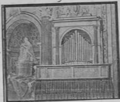
Basilica de Sn. Pedro, Roma. Organo Walcker.

DESDE 1860 SE INSTALARON EN MEXICO ORGANOS DE