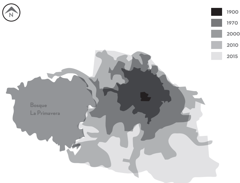
FIGURA 1.2 EXPANSIÓN DE LA ZONA METROPOLITANA DE GUADALAJARA (1900-2015)

Fuente: Blog AnilloPrimavera.org [DE disponible en: https://blog.anilloprimavera.org/2015/12/08/crecimiento-zmg-1900-2015/ ].