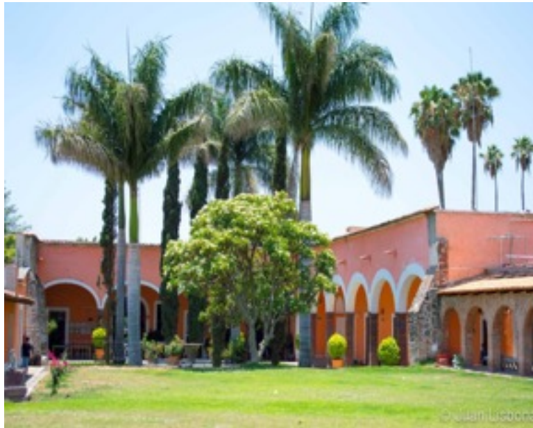
Fig. 1 Ex Hacienda de Huejotitán.