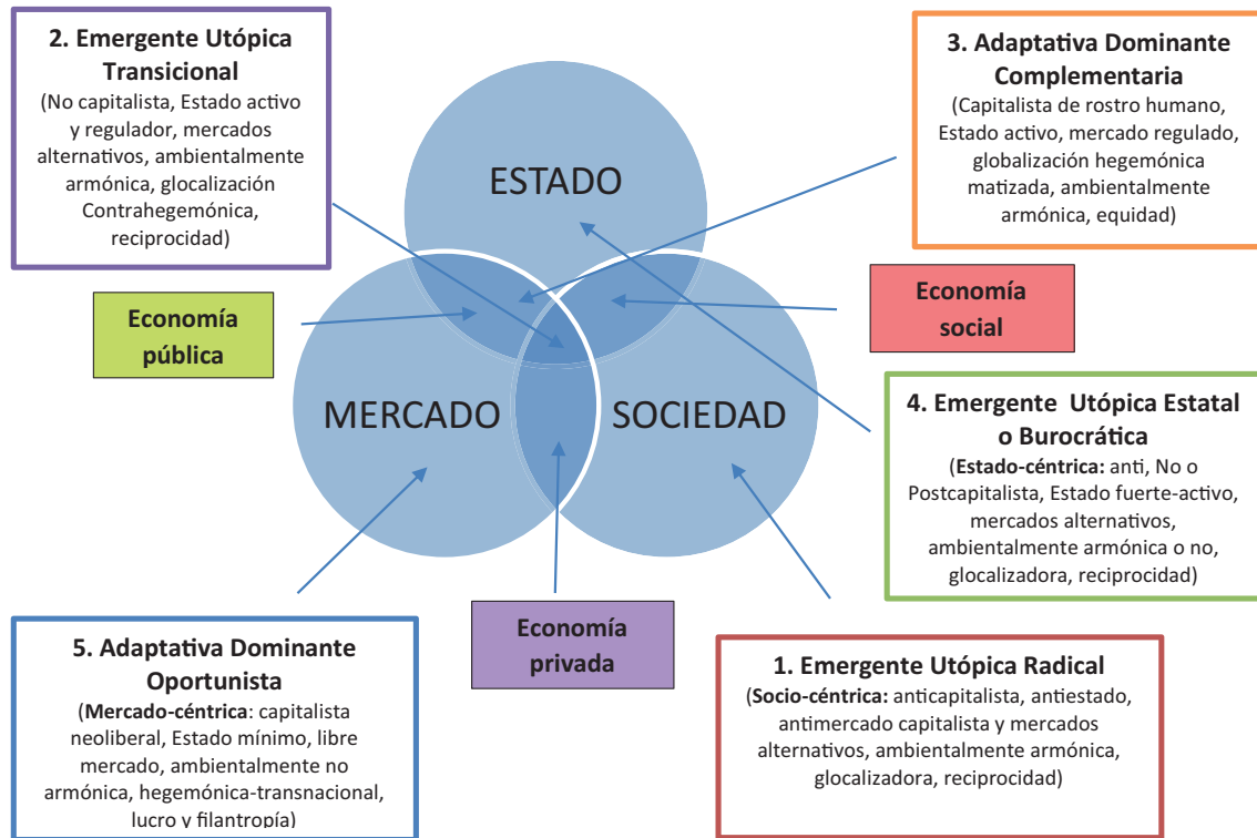
Figura 1. Ecosol complejo. Figure 1. Complex ecosol.

lización, regionalización, nacionalización, transnacionalización o globalización, pero también a algunos de los procesos territoriales reconocibles desde las diversas dimensiones (economía, mercantilización territorial; política, empoderamiento territorial; sociedad, socialización territorial; cultura, significación territorial; medio ambiente, sustentabilización territorial; etc.) y sus procesos contrarios ‘des’ (por ejemplo, des-mercantilización, des-empoderamiento, des-socialización, des-significación, des-sustentabilización);